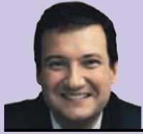
Jordi Hereu Alcalde de Barcelona