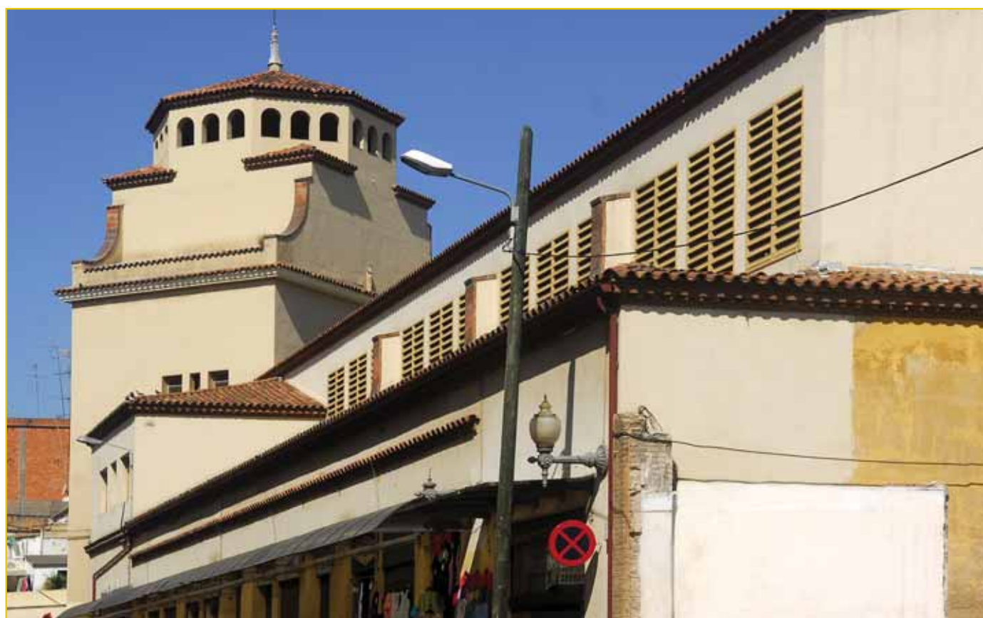
L'antic mercat del Guinardó aviat passarà a la història.

Aquest mercat, situat al carrer Teodor Llorente, disposa d'un ampli aparcament gratuït i de totes les comoditats i serveis per als clients. ■