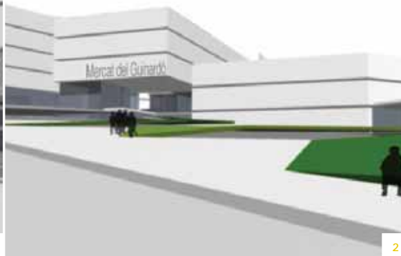
1 i 2. Imatges virtuals de l'entrada del futur mercat. 3. La Pepita Serra Roig, veïna del barri de 96 anys, veu amb il·lusió la nova etapa del mercat. 4. Els comerciants esperen eufòrics l'inici de la remodelació.