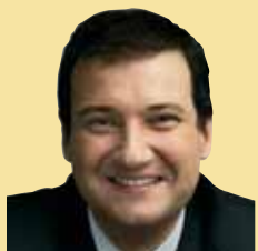
Jordi Hereu Alcalde de Barcelona

Els mercats són espais oberts, de diàleg i relació que ajuden a cohesionar els nostres barris. I són també estructures importants en la vida econòmica de la ciutat. Des dels anys 90, l'Ajuntament ha iniciat un ambiciós pla de modernització i remodelació dels mercats. Estem convençuts que modernitzar els mercats és modernitzar la ciutat i fer de Barcelona un lloc encara millor per viure-hi.