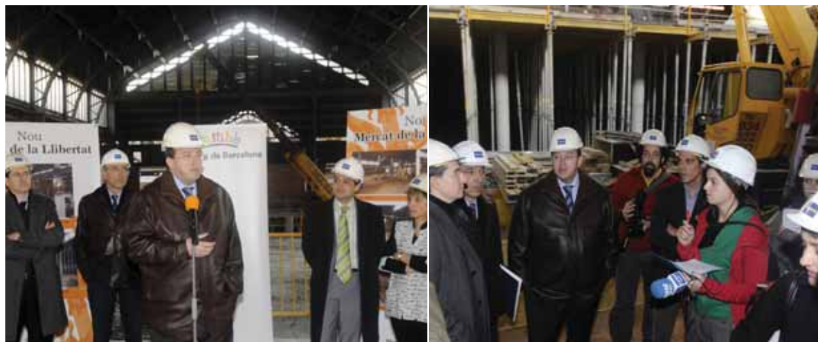
Visita d'obres al Mercat de la Llibertat

Carnes ha mostrat el seu interès per determinats elements històrics que es mantindran en el futur mercat, que combinarà la tradició i la modernitat, tot respectant l'estructura original. ■