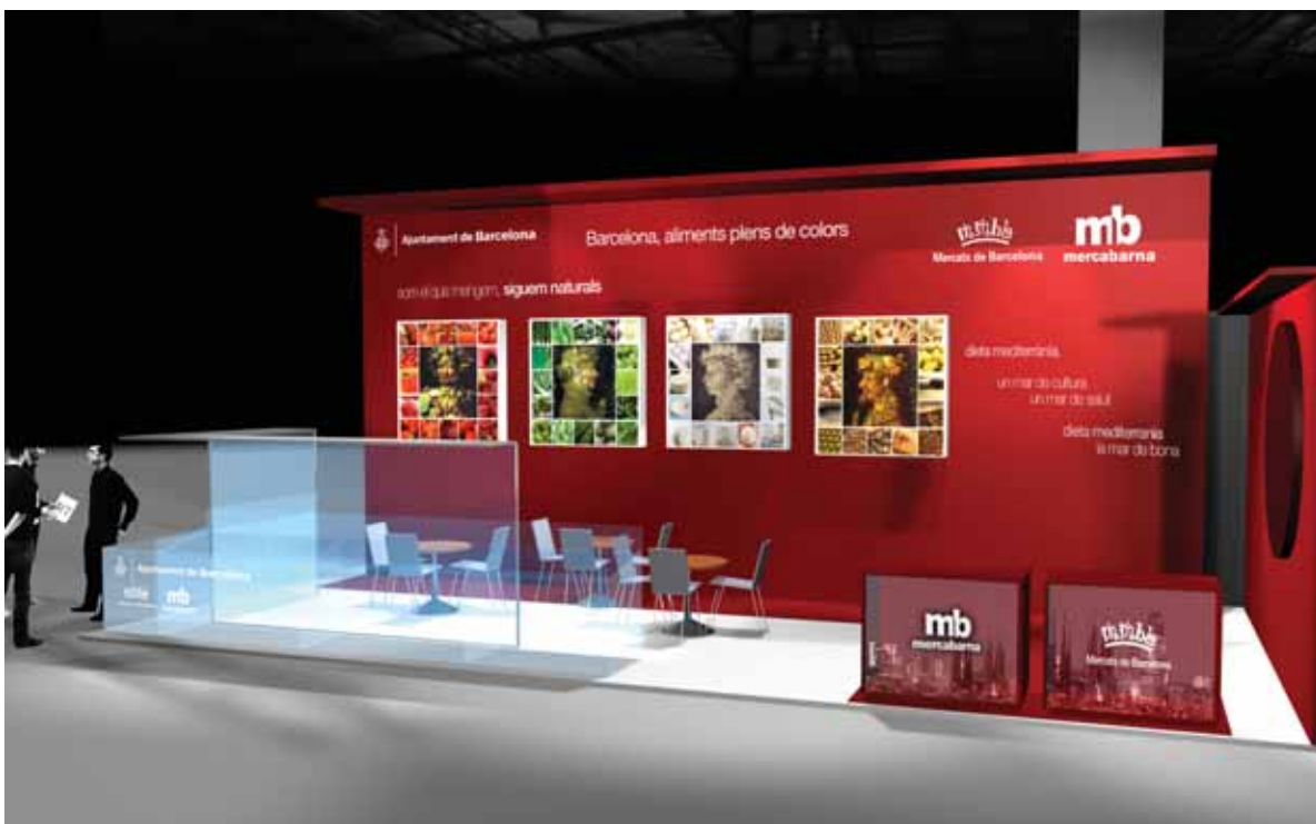
Estand de Mercats de Barcelona i Mercabarna.

Mercats de Barcelona ha tornat a ser present a Alimentària, la segona fira més important del sector a Europa i un dels esdeveniments més rellevants que es duen a terme anualment a la Fira de Barcelona.