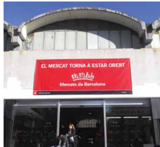
En marxa la remodelació del Mercat de les Corts

Els treballs de construcció de la façana principal s'han iniciat el mes de febrer i està previst que s'enllesteixin en el decurs del mes de maig de 2008. ■