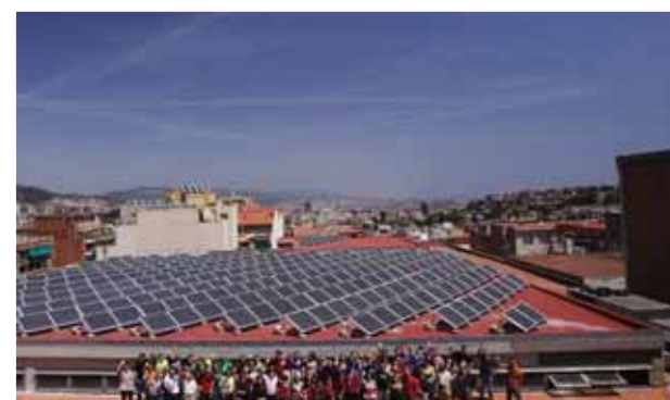
Plaques fotovoltaïques al Carmel

L'acte de lliurament s'ha dut a terme el 28 de gener de 2008 a la seu de la Universitat Oberta de Catalunya, UOC. ■