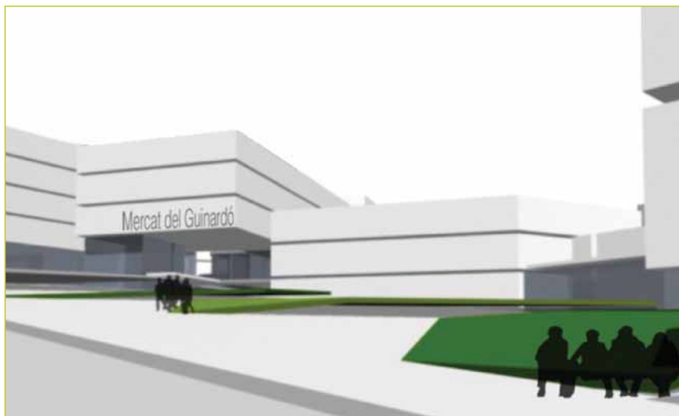
Imatge virtual del futur mercat del Guinardó.