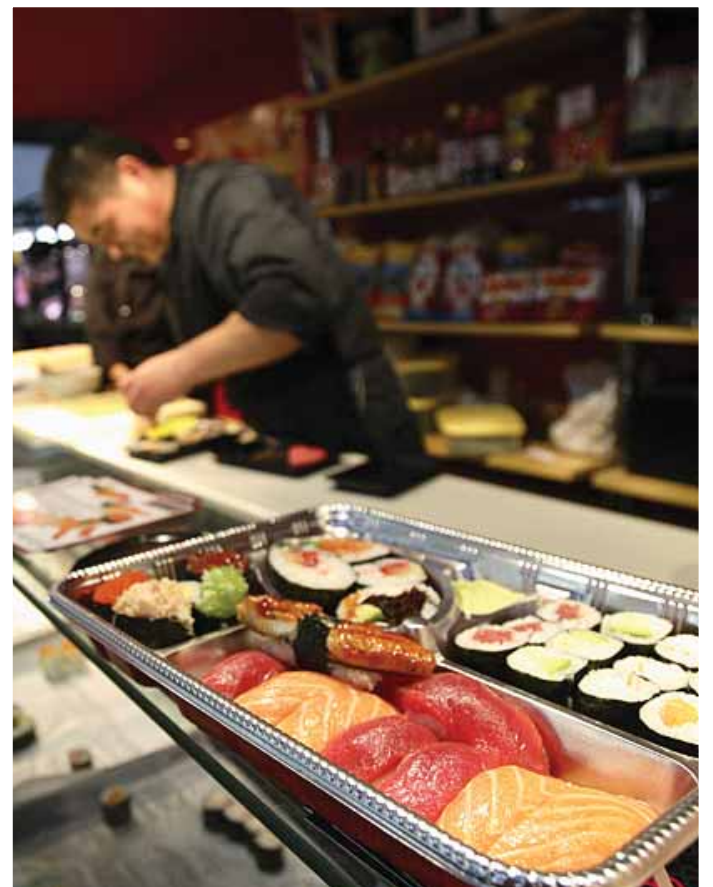
Parada de menjars preparats.

En posteriors fases i atenent a la naturalesa i característiques de l'establiment, serà requisit necessari la sol.licitud d'una Autorització sanitària per la comerç minorista de carn fresca , o bé la inscripció en el Registre Sanitari d'Aliments , segons procedeixi. ■