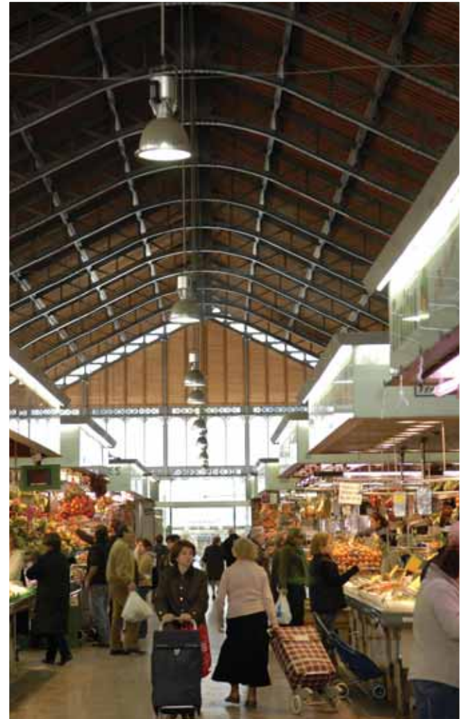
A l'esquerra vista exterior de l'estructura. A dalt, vista de l'interior del mercat.

En el marc de les celebracions destaca l'acte d'entrega dels Pebrots d'Or del Carnaval 2008, la inauguració de la biblioteca d'intercanvi de llibres per la festivitat de Sant Jordi, i en motiu de la Fira Modernista que se celebra des de fa uns anys, la realització d'una exposició retrospectiva. ■