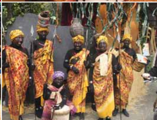
Els comerciants disfressats per Carnaval