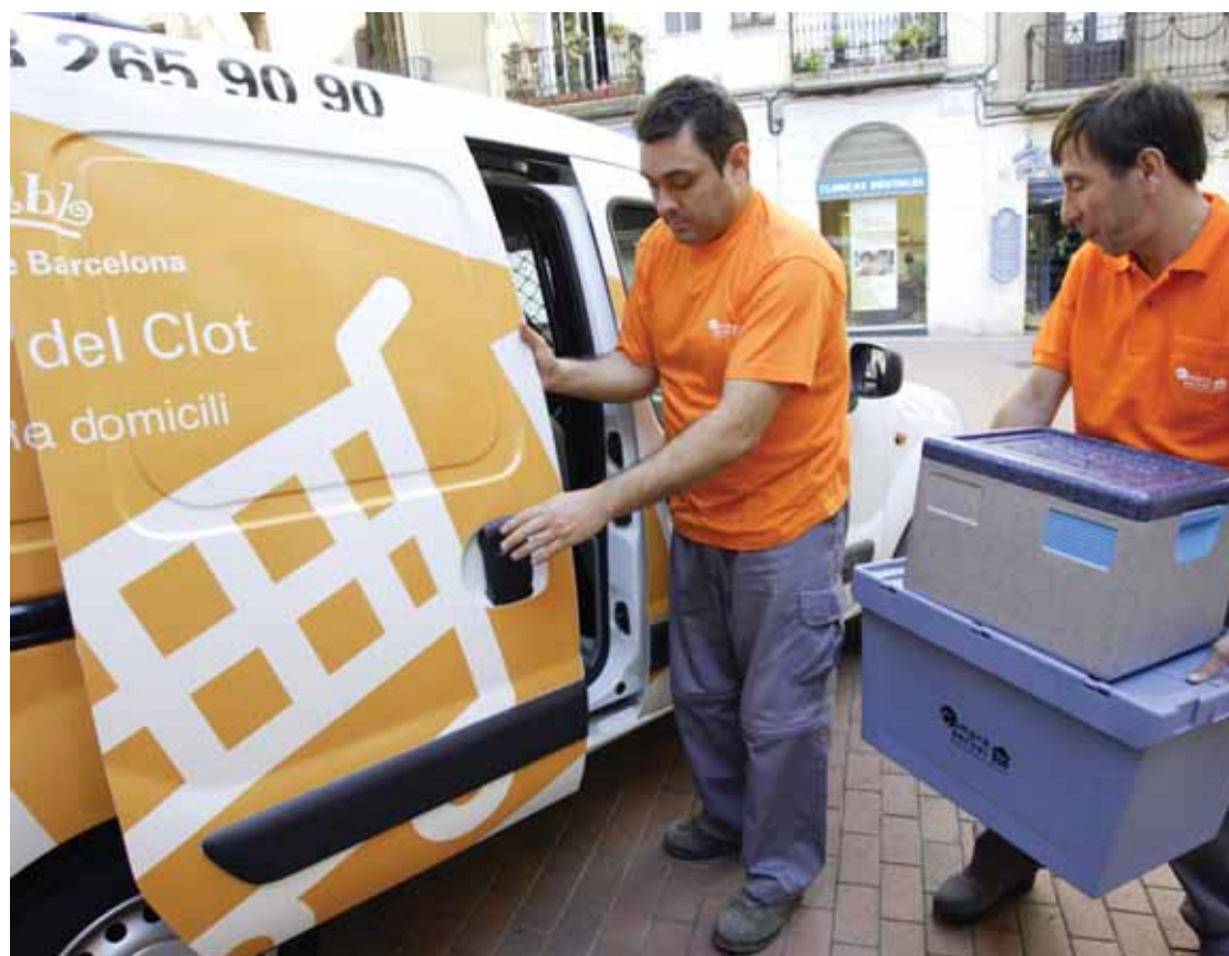
Furgoneta de repartiment a domicili del mercat del Clot

Els mercats d'Horta i el de Santa Caterina disposen de noves furgonetes per al servei a domicili. Les noves furgonetes isotèrmiques recentment adquirides que realitzen el servei de repartiment a domicili en aquests mercats són de la marca Ford Trànsit i Iveco, respectivament.