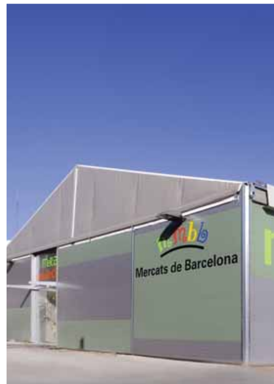
El mercat provisional del Guinardó

En breu s'iniciaran les obres de demolició de l'antic mercat, del qual es mantindrà la bòveda de l'entrada degut al seu interès patrimonial. ■