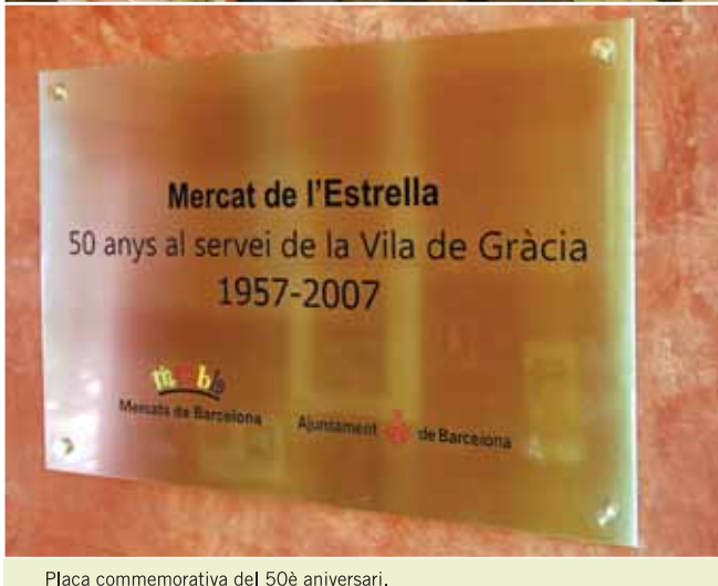
Placa commemorativa del 50è aniversari.