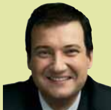
Jordi Hereu Alcalde de Barcelona

Els mercats són espais oberts, de diàleg i relació que ajuden a cohesionar els nostres barris. I són també estructures importats en la vida econòmica de la ciutat. Des dels anys 90, l'Ajuntament ha iniciat un ambiciós pla de modernització i remodelació dels mercats. Estem convençuts que modernitzar els mercats és modernitzar la ciutat i fer de Barcelona un lloc encara millor per viure-hi.