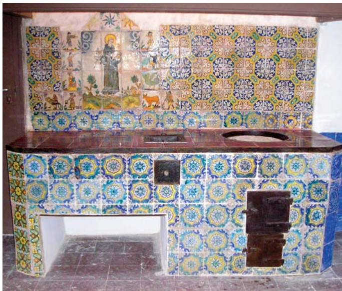
La cuina de Sant Antoni després de la restauració

Es tracta d'una estructura de maons recoberta amb rajoles vidrades policromades de diferents tipus i datacions on s'insereix un únic fogó de carbó. D'entre tota la decoració, destaca el frontal de la paret amb la representació de Sant Antoni: un plafó hagiogràfic format per dotze rajoles vidrades, que representen la imatge del sant amb el nen Jesús als braços envoltat de núvols i un paisatge de cases i arbres. Al seu voltant se situen d'altres rajoles figurades amb la representació de músics i