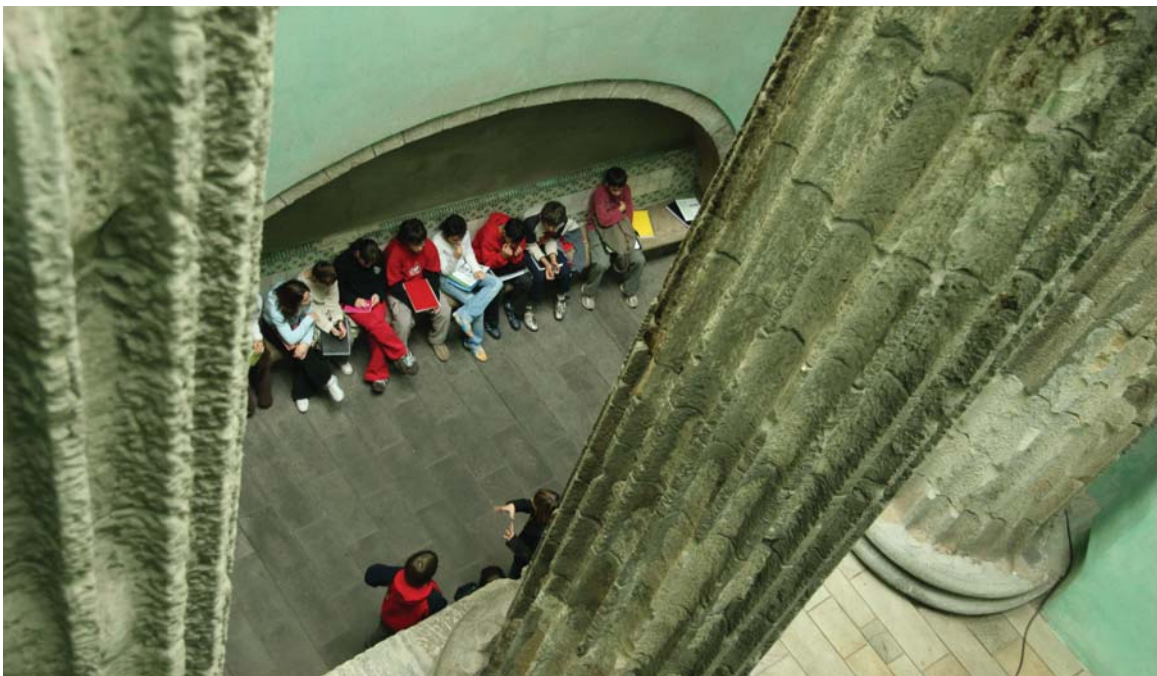
Visita escolar al temple d'August

El mes de juny de 2007, després de les exposicions fotogràfiques, les desfilades de moda romana, els tallers de cuina, els jocs romans i altres activitats que preveuen les unitats didàctiques dissenyades, caldrà avaluar el resultat de la primera edició d'aquest projecte, amb la voluntat de millorar tot el que convingui fins convertir-lo en una veritable eina de construcció al servei del futur.