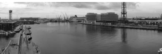
[a baix] La mateixa vista del port de Barcelona captada l'any 2005 per Manel Pérez. Muntatge digital de Francisco Duarto.