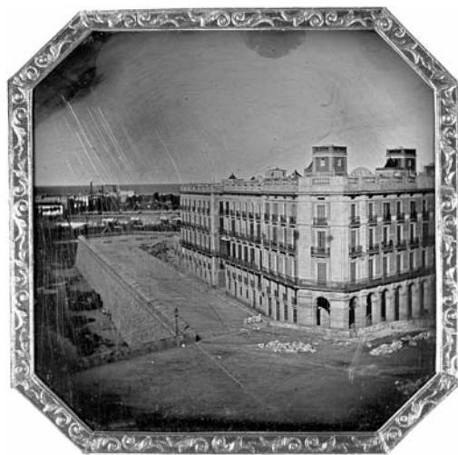
Col·lecció particular, Tarragona