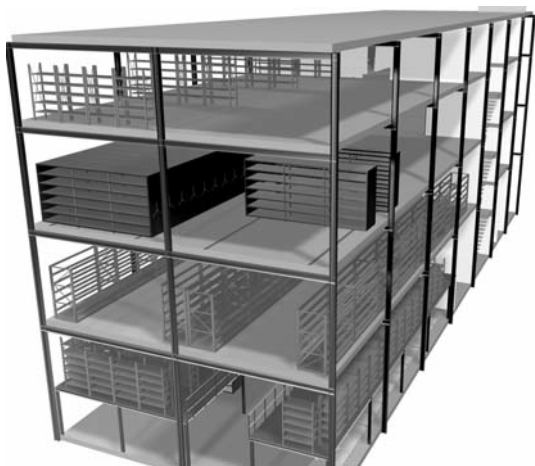
Vista en 3D de les instal·lacions del nou edifici de Zona Franca

El principi bàsic d'una sala de reserva és que cada objecte tingui un espai reservat concret i exclusiu, i que les instal·lacions auxiliars facilitin que les manipulacions dels objectes es portin a terme amb el mínim de risc per a aquests i per a les persones.