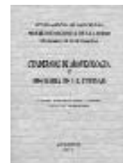
Portada del primer número de Cuadernos de Arqueología e Historia de la Ciudad de Barcelona

referència a l'hora de treballar a Barcelona.