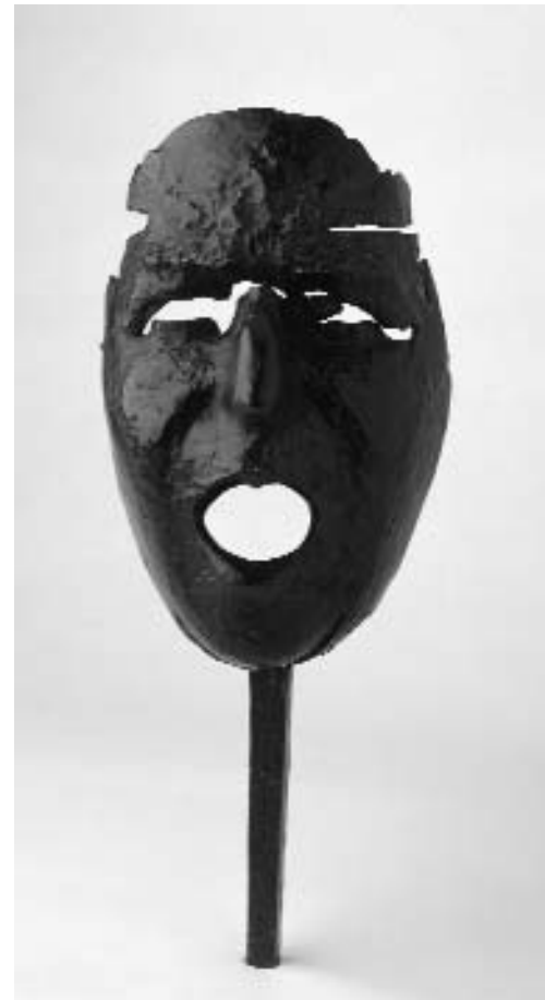
Julio González, Màscara de Montserrat cridant, 1938-39, IVAM, Institut Valencià d'Art Modern.

La reflexió sobre els tres grans eixos escollits no neix amb el Fòrum ni té aturador quan aquest acabi les activitats programades. L'MHCB contribuirà a la seva continuïtat més enllà del 2004.