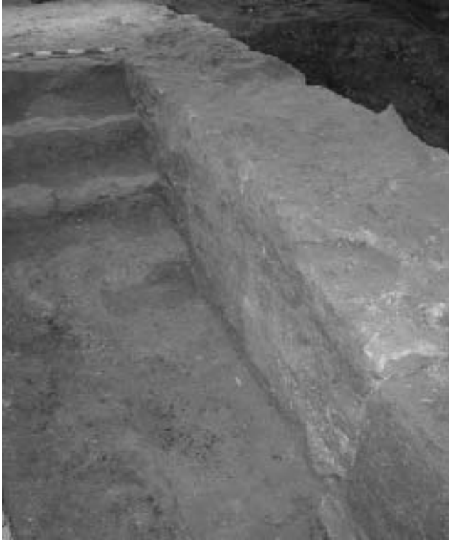
Detall de l'excavació al carrer de Regomir

D'entre les moltes llacunes de coneixement que hom té sobre les estructures de la colònia romana s'ha destacat moltes vegades la funcionalitat i la cronologia