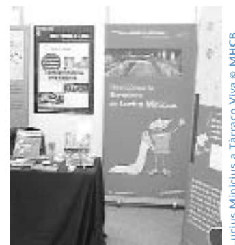
Lucius Minicius a Tàrraco Viva

Del 18 al 30 de maig, el Museu ha participat en les VI Jornades Internacionals de Divulgació Històrica Romana a Tarragona. Tàrraco Viva és un dels festivals més consolidats de divulgació històrica d'Europa, amb cicles de conferències, grups de reconstrucció històrica, gastronomia, tallers i jocs entorn del món romà, entre altres activitats. El Museu va participar en la Fira Interna-