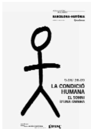
Portada de l'últim Quadern d'Història

dels Quaderns d'Història . Aquests quaderns, encarats a la revista L'Avenç i de publicació bianual, ens acosten totes les activitats de l'MHCB i inclouen articles informatius sobre les exposicions temporals, les