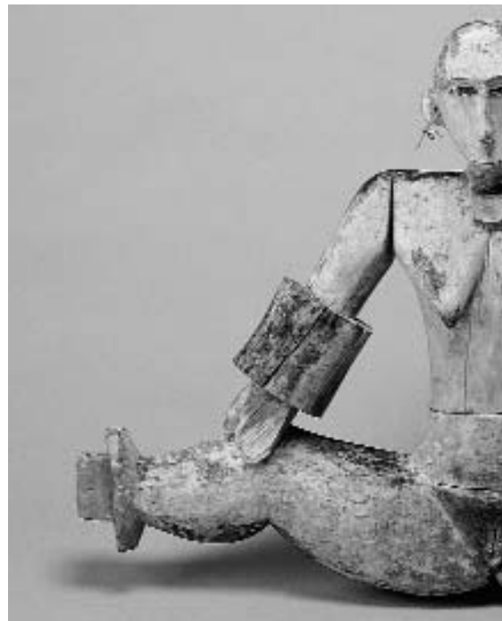
Escultura femenina Dilukai. Micronèsia. Illes Palau

«Potser el problema més important d'aquest segle i mil·lenni que acaba de néixer és l'articulació d'allò que ens és comú –o del que subsisteix i persisteix com a humana conditio – i la gran diversitat de formes culturals en què aquesta es manifesta. Reconèixer la diversitat i harmonitzar-ne els sentis inherents i peculiars ens allunya de la forma violenta de la intolerància que suposa consentir el conflicte entre civilitzacions»