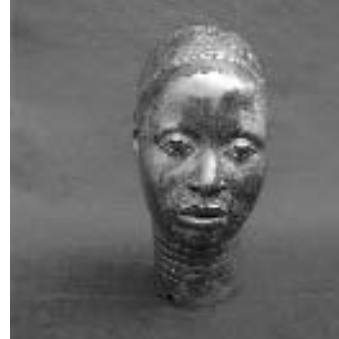
Cap huma. Segles XII-XV. ITE, Nigèria. The National Commission for Museums and Monuments, Nigèria