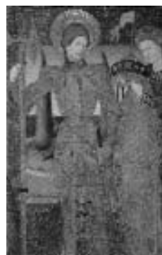
Jaume Huguet, Sant Jordi i la princesa. Cap a 1459-1475

L'MHCB, en col·laboració amb els Amics del MNAC, us convida el proper dissabte 18 de setembre , a les 11 h, a fer una visita exclusiva a les col·leccions permanents d'art romànic i gòtic del MNAC.