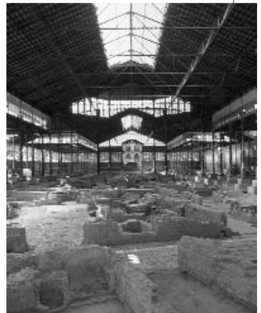
Interior del mercat del Born amb les restes excavades.

Horari d'atenció: de dilluns a divendres de 10 a 14 h dimarts i dijous de 16 a 18 h