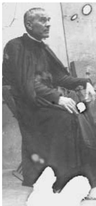
Jacint Verdaguer posant al taller d'Eusebi Arnau, c.1901