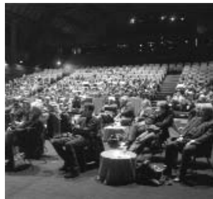
Sala March del Mercat de les Flors.

Com sabeu, podreu gaudir d'un descompte del 25% per cada amic o amiga i acompanyant en alguns espectacles del Mercat de les Flors.