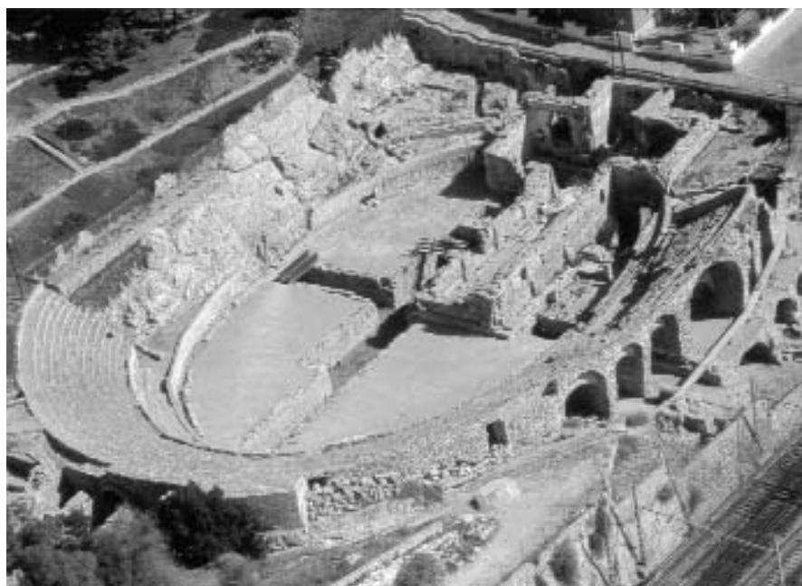
Amfiteatre romà, d'inicis del segle II

Tots els amics i amigues del Museu d'Història de la Ciutat ja som experts en el nostre passat romà! Us proposem anar a visitar la capital de la Tarraconensis en època romana.