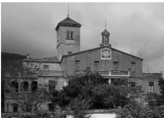
El Museu-Casa Verdaguer a Vil·la Joana, Vallvidrera

Al llarg dels dissabtes del mes de maig, ha tingut lloc el V Cicle de Conferències