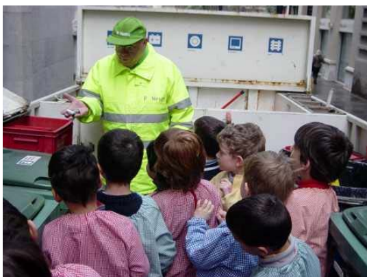
Recollida Selectiva Escoles Curs'05/06

Des de fa dos cursos comptem amb un Pla Pilot de Recollida Selectiva que inclou actualment 28 centres dels districtes de Gràcia (7) , Sarrià-Sant Gervasi (10) i Horta-Guinardó (11) . Aquesta iniciativa segueix en marxa en el curs que tot just acabem de començar amb la intenció d'ampliar el número de centres implicats.