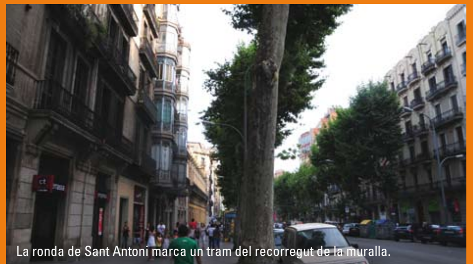
La ronda de Sant Antoni marca un tram del recorregut de la muralla.