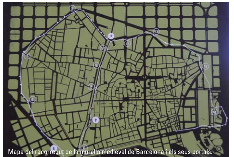
Mapa del recorregut de la muralla medieval de Barcelona i els seus portals.