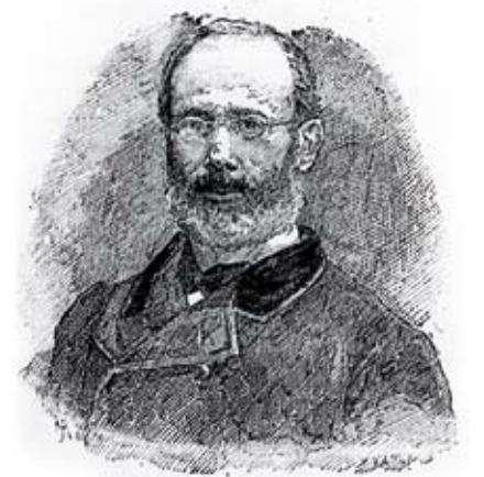
Pere Felip Monlau