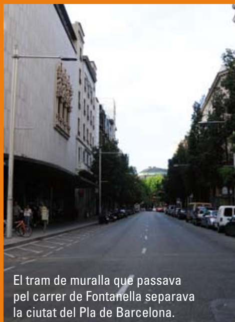
El tram de muralla que passava pel carrer de Fontanella separava la ciutat del Pla de Barcelona.