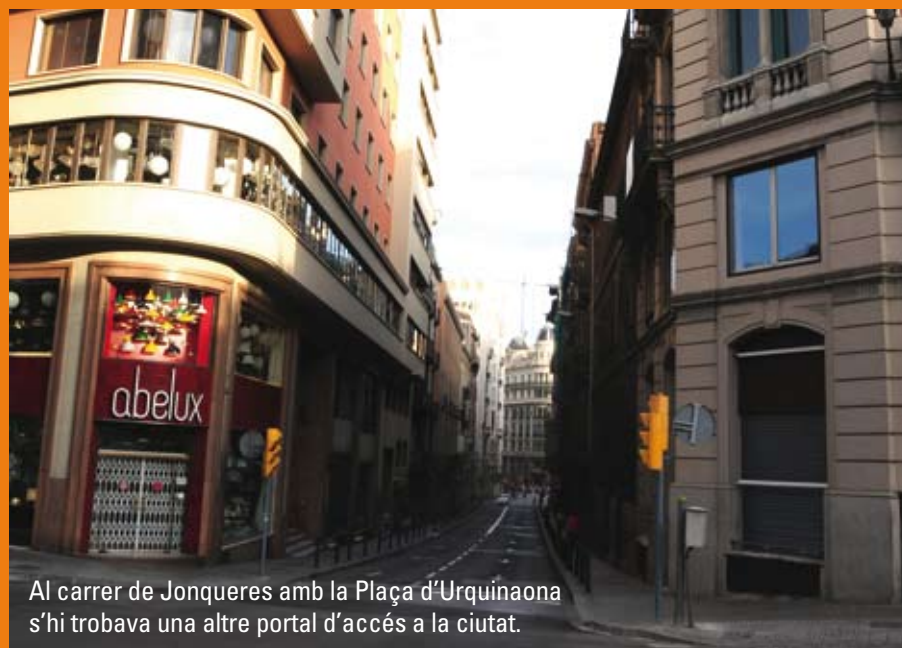
Al carrer de Jonqueres amb la Plaça d'Urquinaona s'hi trobava una altre portal d'accés a la ciutat.

clar que Barcelona està destinada a convertir-se en una gran capital moderna, que podrà rivalitzar amb París, Londres o Madrid. Enderrocar les muralles és, però, evidentment, una condició indispensable per a iniciar la transformació de la ciutat. Resulta fàcil imaginar les conseqüències immediates que, en l'àmbit de la indústria, es viuran en la Barcelona lliure de parets. Les deu fàbriques amb màquines de vapor que hi ha a la ciutat mentre Monlau escriu es triplicaran —o quadruplicaran—, i això implicarà una conseqüent competència entre aquestes empreses, la qual acabarà desembocant en el perfeccionament dels productes manufacturats. Tot plegat augmentarà les exportacions dels productes barcelonins i donarà riquesa als seus ciutadans. Però, més enllà dels aspectes econòmics durs, la visió de Monlau de la Barcelona eixamplada també és la d'un humanista que vol una capital més cosmopolita que atraurà estrangers —capitalistes creadors d'indústria, però també autoritats científiques i literàries— i on proliferaran biblioteques, museus, teatres, gabinets de lectura, escoles de natació i casinos.