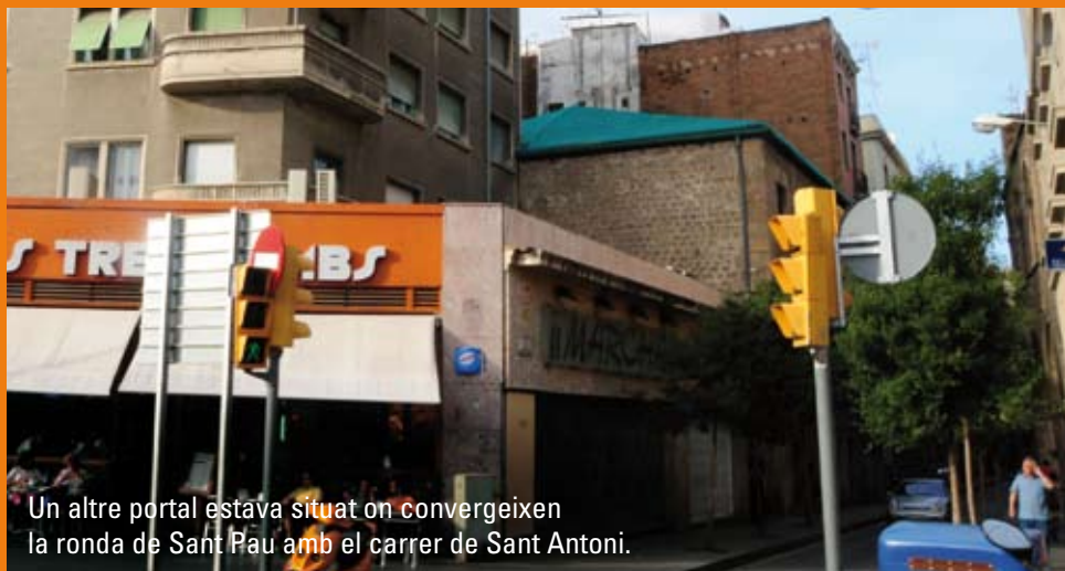
Un altre portal estava situat on convergeixen la ronda de Sant Pau amb el carrer de Sant Antoni.