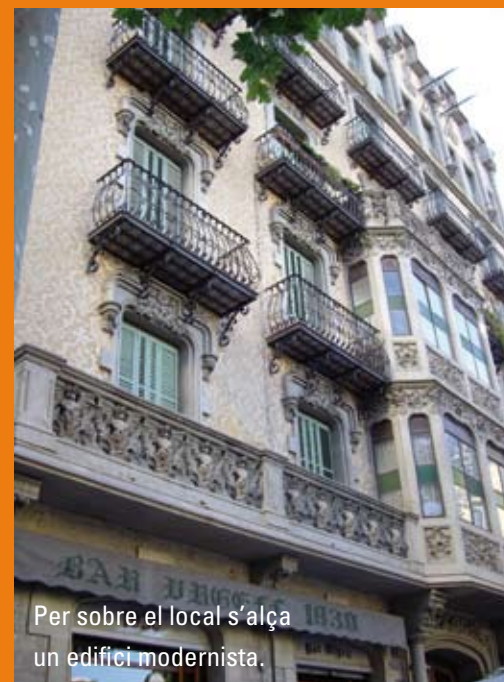
Per sobre el local s'alça un edifici modernista.