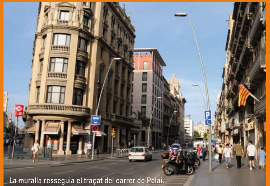
La muralla resseguia el traçat del carrer de Pelai.