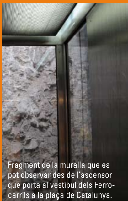
Fragment de la muralla que es pot observar des de l'ascensor que porta al vestíbul dels Ferrocarrils a la plaça de Catalunya.