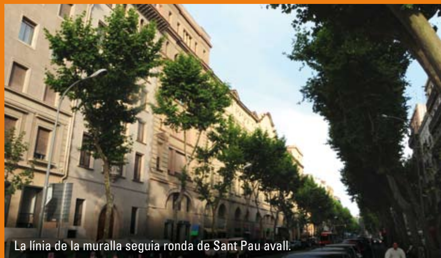
La línia de la muralla seguia ronda de Sant Pau avall.