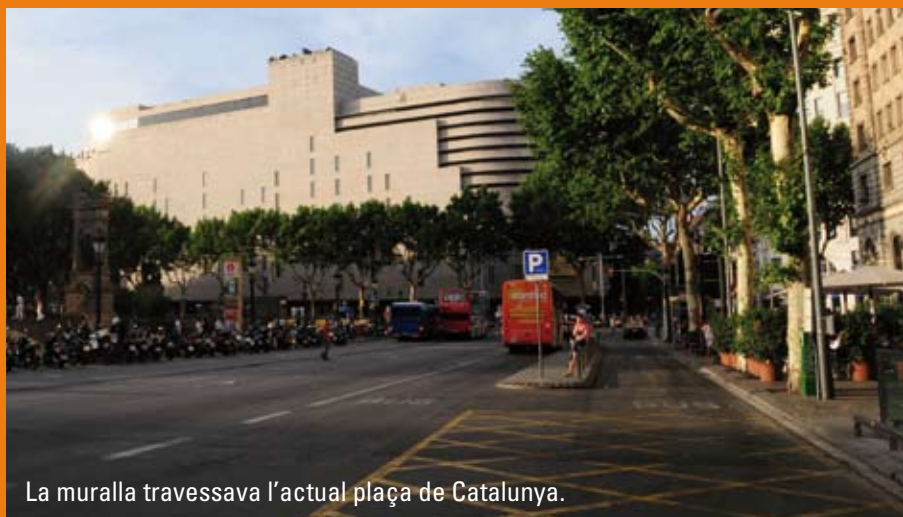
La muralla travessava l'actual plaça de Catalunya.

“La mezcla fraternal de hábitos, costumbres é idiomas diversos familiariza á los hombres entre sí, desvanece necias antipatías, y á todos los hace en cierto modo practicamente cosmopolitas. [sic]” Monlau té bastant