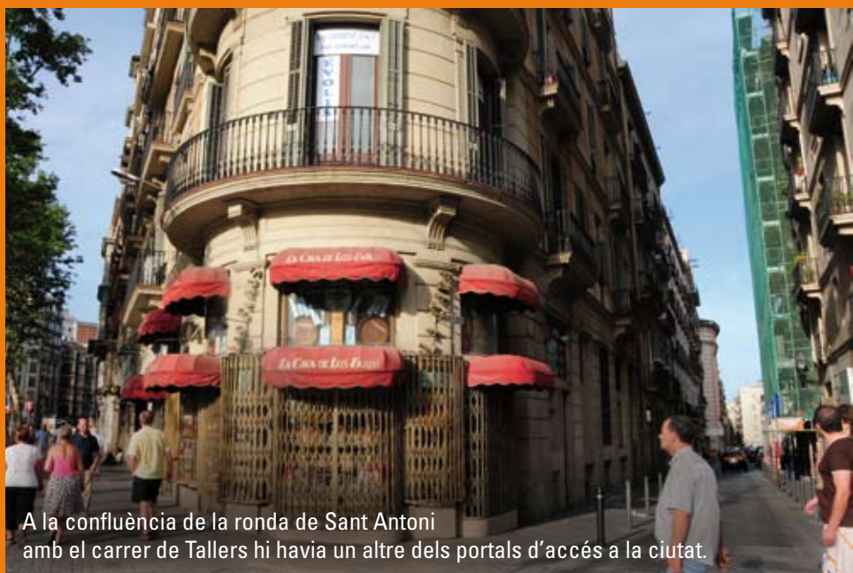
A la confluència de la ronda de Sant Antoni amb el carrer de Tallers hi havia un altre dels portals d'accés a la ciutat.