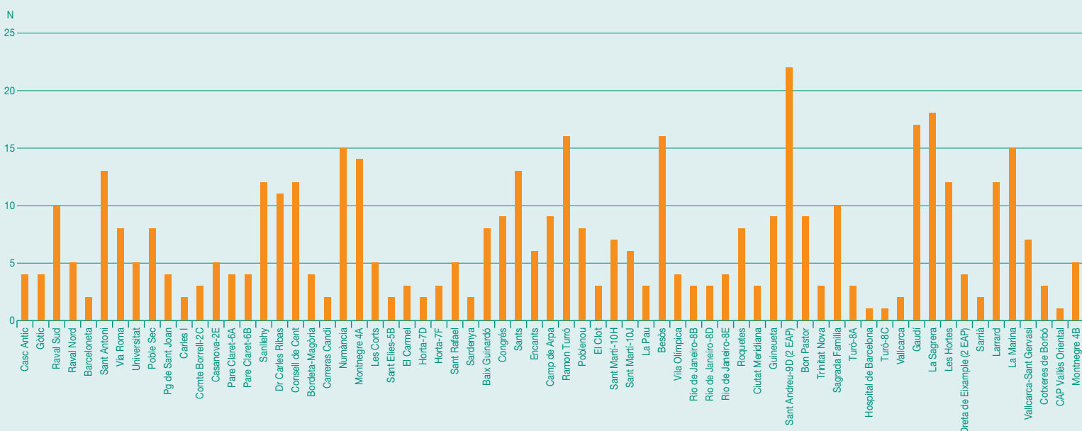
Figura 3. Distribució dels casos notificats segons centre notificador. Barcelona, 2013.

Va augmentar un 27% els notificadors i notificadores (en van ser 304) i disminuir un 3% els EAP que van notificar almenys un cas (67 centres).