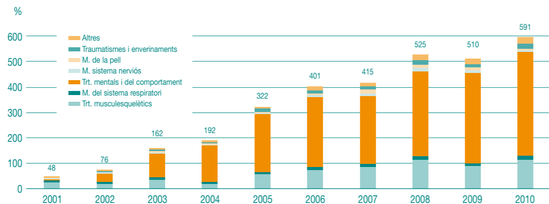
Figura 1. Distribució dels casos notificats segons diagnòstic i any de notificació. 2001-2010