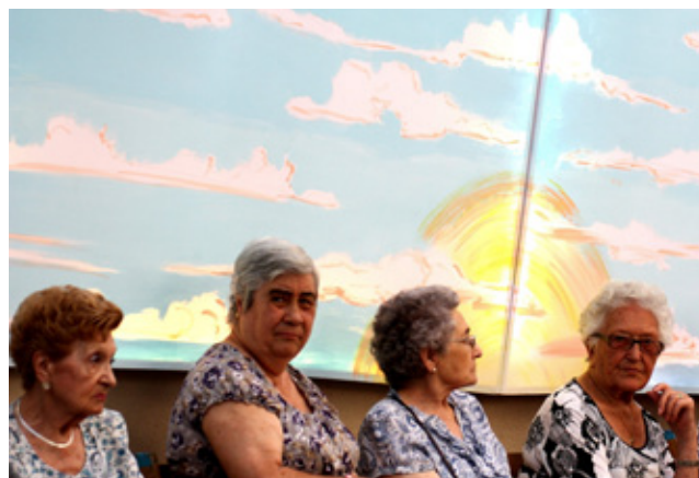
Fotografia d'en Sergi Panizo, tercer premi del concurs a millor fotografia de les festes de Gràcia 2012

El mes de gener d'enguany es van atorgar els premis a les millors fotografies fetes durant la Festa Major de Gràcia de 2012.