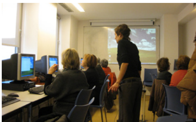
Activitat cultural de Ciberdona al Casal de Barri Cardener