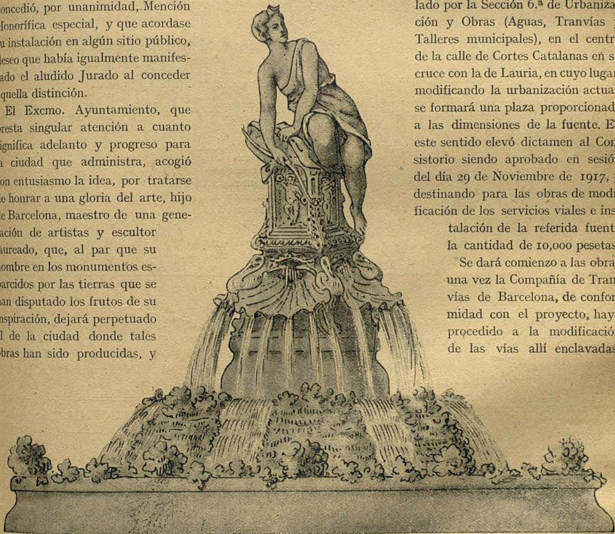
VISTA DE CONJUNTO DE LA FUENTE

Se dará comienzo a las obras una vez la Compañía de Tranvías de Barcelona, de conformidad con el proyecto, haya procedido a la modificación de las vías allí enclavadas.