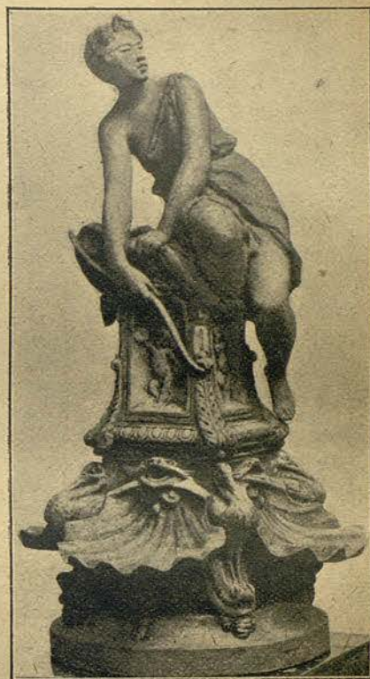
ESTATUA, ESCULPIDA POR VALMITJANA, QUE REMATARÁ LA FUENTE

PROYECTO DE INSTALACIÓN DE LA FUENTE DE DIANA, EN EL CRUCE DE LAS CALLES DE CORTES CATALANAS Y LAURIA