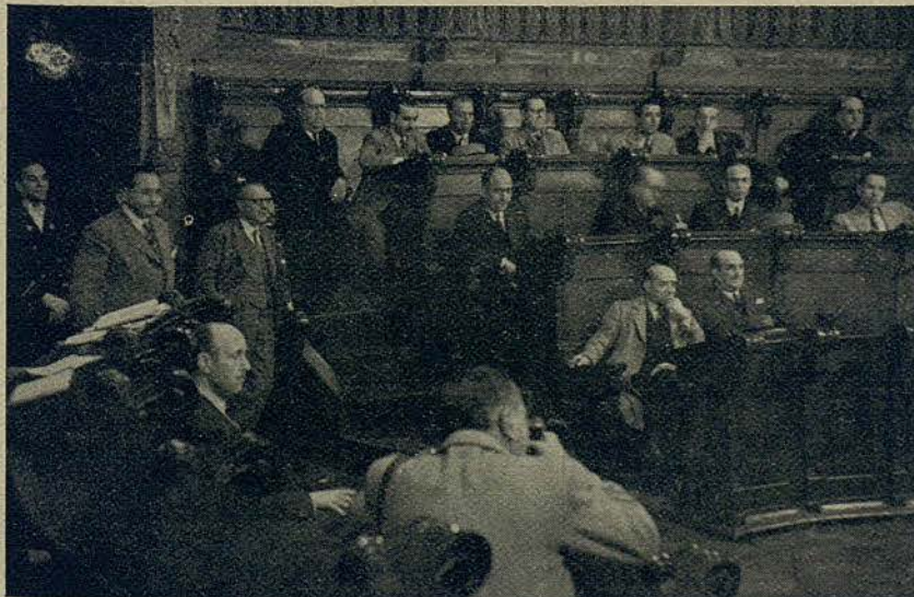
Aspecto del Salón de la Reina Regente en la sesión de proclamación de candidatos a Concejales