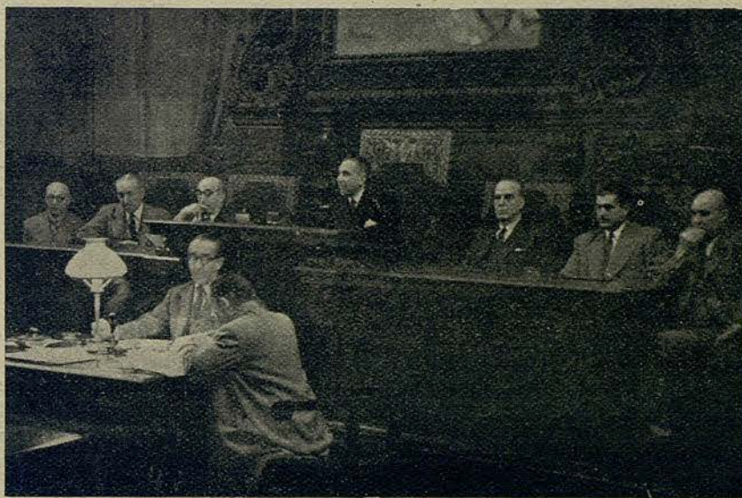
La Presidencia de la Junta Municipal del Censo Electoral en el acto de proclamación de candidatos a Concejales