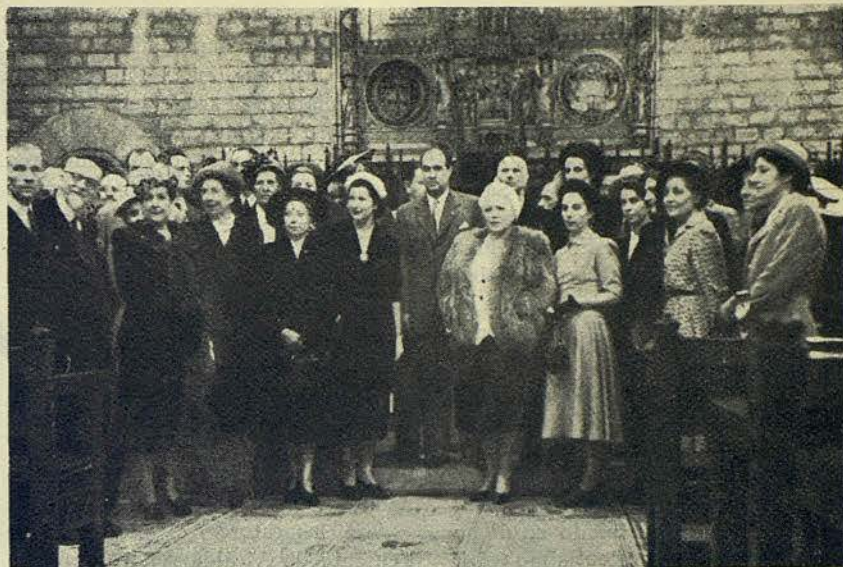
Los componentes de la Asociación Médica Mundial durante la visita que efectuaron a la Casa de la Ciudad

En el despacho de la Alcaldía, el día 26 del mes de abril próximo pasado, firmáronse las actas administrativas de conciertos con diversos gremios de cafés, restaurantes y tabernas. También fué firmado el con-