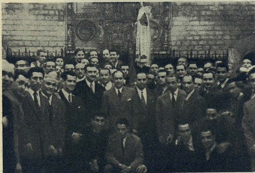
El equipo del Club de Fútbol Barcelona durante la recepción con que fué agasajado por el Ayuntamiento, con motivo de haber salido triunfante en el Campeonato de Liga

DÍA 20 DE ABRIL. — A las veinte tuvo lugar una extraordinaria recepción, en la Casa de la Ciudad, a los componentes del Club de Fútbol Barcelona, Campeón de Liga. Fueron recibidos por el excelentísimo señor Alcalde accidental, señor Barón de Esponellá, y varios señores Tenientes