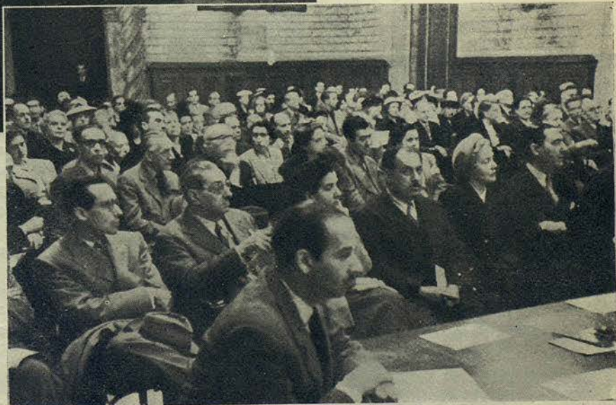
El ilustre filósofo don Eugenio d'Ors pronunciando su conferencia en la sesión de homenaje a la memoria de Adrián Gual, y aspecto que ofrecía el Salón de Ciento durante la celebración del acto

Don Eugenio d'Ors trató magistralmente de la personalidad de Adrián Gual, y esbozó un interesante estudio sobre el modernismo, señalando el lugar que le cabía en su época al ilustre homenajeado, enfrentando su arte y sus reacciones con el de otras figuras de su tiempo. El público siguió con el máximo interés la brillante di-