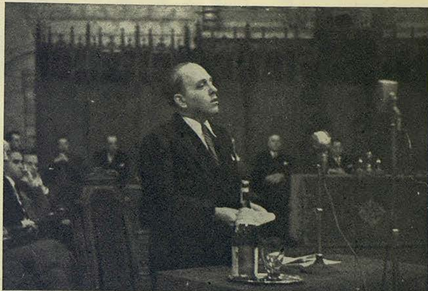
El Embajador del Perú, don Raúl Porras, en el transcurso de su conferencia, desarrollada en el Salón de Ciento.

El Tribunal, constituido, para cada una de las especialidades, por los res-