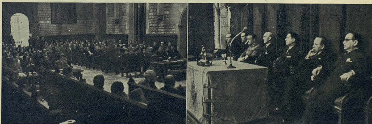
Aspecto que ofrecía el Salón de Ciento durante la conferencia dada por el Embajador del Perú, y autoridades que constituían la presidencia del acto.

Efectuado el reparto de todos los premios, cerró el acto el mencionado señor Delás con unas breves palabras de felicitación para los ganadores, que hizo extensiva a todos los demás con-