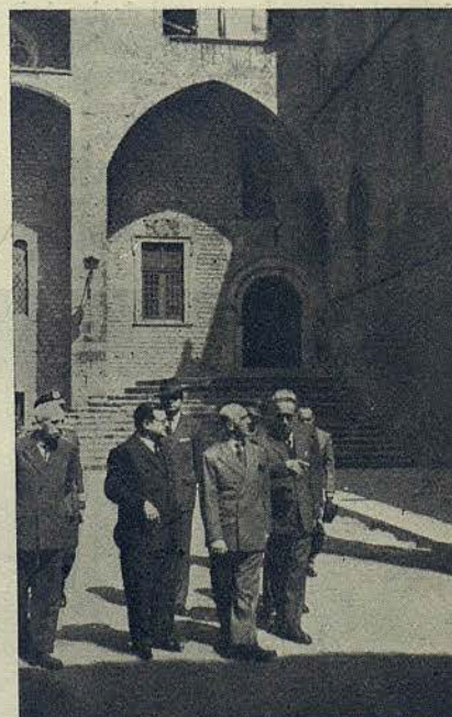
El ex Presidente del Perú, don Manuel Prado, visitando el Barrio Gótico, en compañía de los facultativos del Ayuntamiento

Durante la semana del 9 al 15 del mes de mayo de 1949 se registraron en Barcelona 387 nacimientos y 231 defunciones.