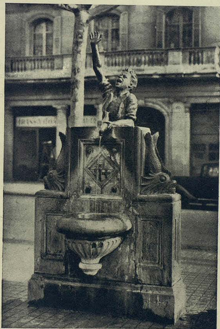
Fuente artística situada en la avenida del Generalísimo Franco y calle de Casanova (Obra del escultor Benedito)