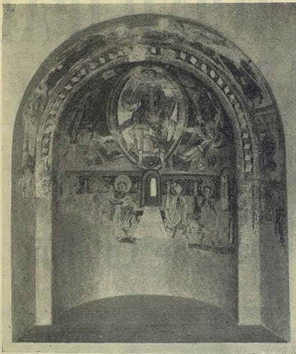
San Miguel Engolasters, pintura mural del siglo XII

La adaptación de la pintura mural a la Sección románica del Museo fué realizada de una manera perfecta. Cuidadosamente transportadas desde los muros originarios en donde se encontraban hasta los paramentos preparados al efecto en el Museo para su adaptación, de forma que el visitante puede contemplar las decoraciones murales como se hallaban en su lugar originario, pues que se ha tenido empeño — superando toda clase de dificultades — en conservar la idéntica disposición, igualmente en los ábsides semiesféricos, arcos, etc., de donde fueron arrancadas.