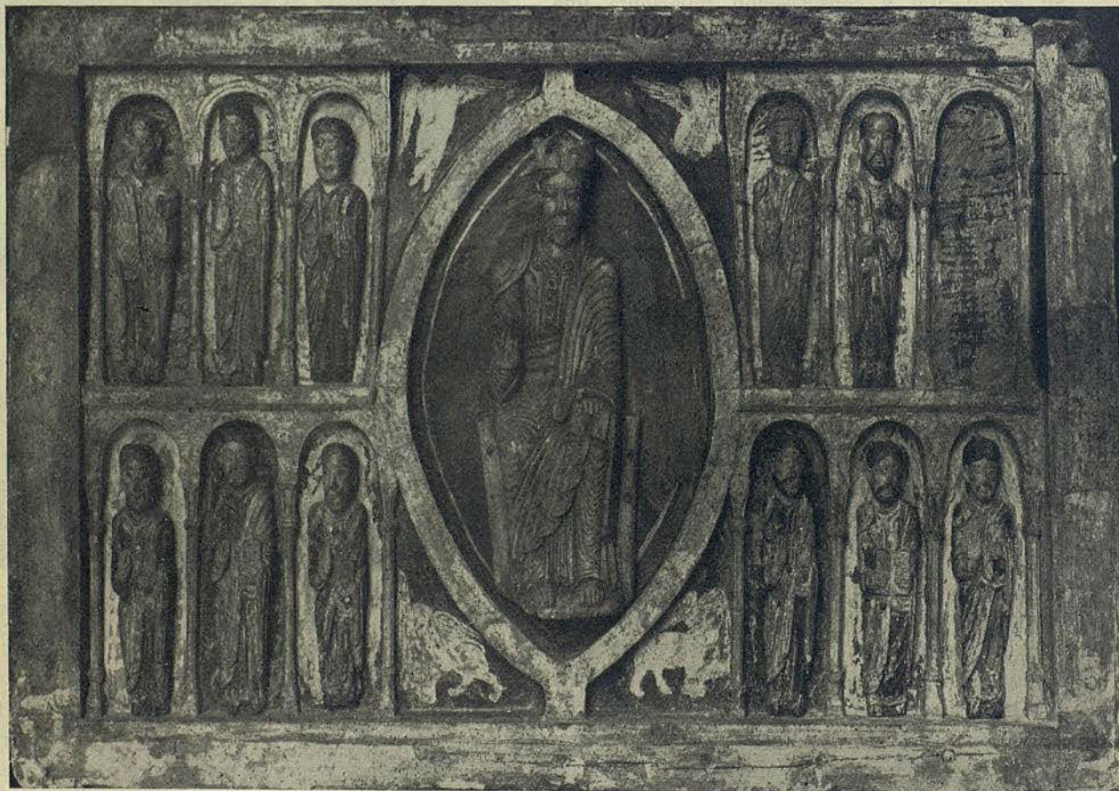
Frontal de altar de San Clemente de Tahull, en talla policromada, del siglo XII

Sucesivamente seguiremos ocupándonos de esta faceta de la labor municipal que es orgullo de los barceloneses y motivo de admiración de los extranjeros que visitan las salas de nuestros Museos.