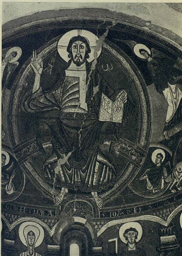
Pinturas murales del ábside de San Clemente de Tahull, del siglo XII

Es de destacar, entre las diversas secciones, la correspondiente al arte románico, que la forman dieciséis salas, en las cuales han sido instaladas las decoraciones al fresco procedentes de varias iglesias de la región pirenaica, junto a otras obras pictóricas ejecutadas sobre tabla, así como interesantes ejemplares escultóricos en madera, piedra, etc.