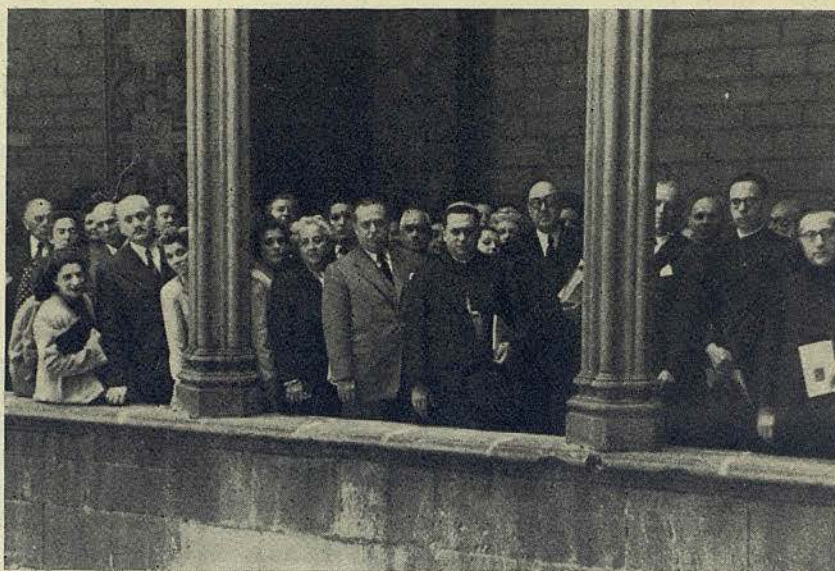
Peregrinos sudamericanos en su visita a las Casas Consistoriales

El jueves, día 20 del próximo pasado mes de mayo, el ilustre señor