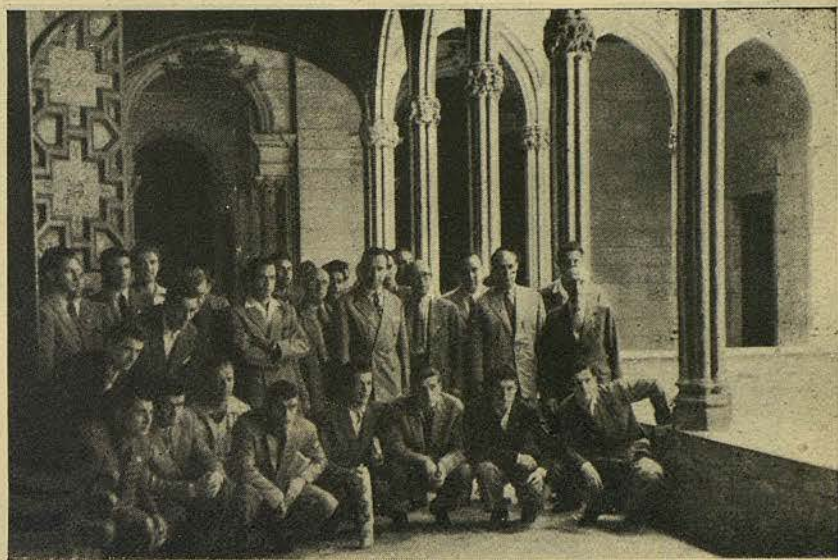
Los equipos de Reims y Torino, en su visita a la Casa de la Ciudad

Fueron recibidos por el Teniente de Alcalde delegado especial de Depor-