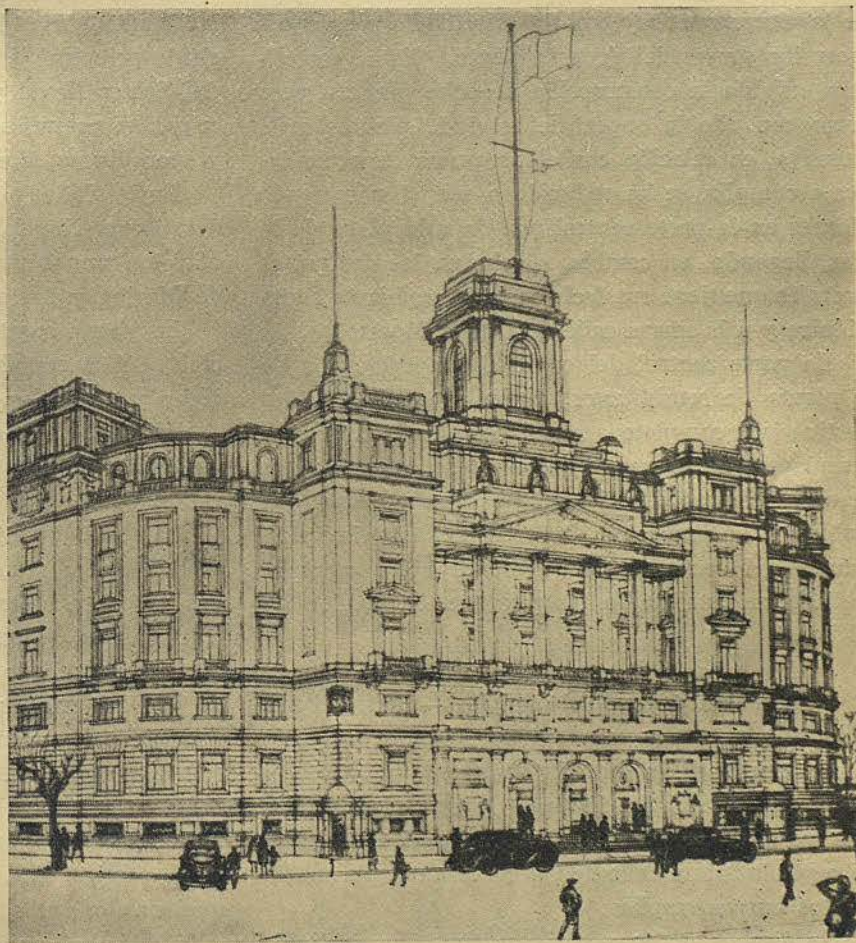
Perspectiva del edificio que ha de destinarse a Comandancia del Sector Naval de Cataluña, de estilo neoclásico

El solar propiedad del Ayuntamiento quedará dividido en dos partes por un patio y dos callejones de acceso, que lindan con el edificio por su parte pos-