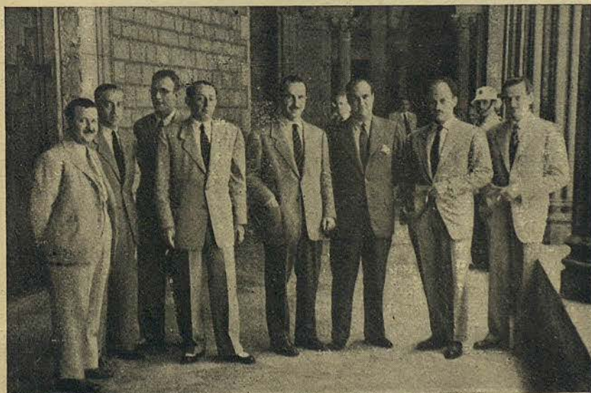
Los componentes de la selección española, subcampeones mundiales de hockey, durante la visita que hicieron al Ayuntamiento

Este sistema de alumbrado proporciona una iluminación mucho más intensa, con una notable economía en el consumo de fluido eléctrico.