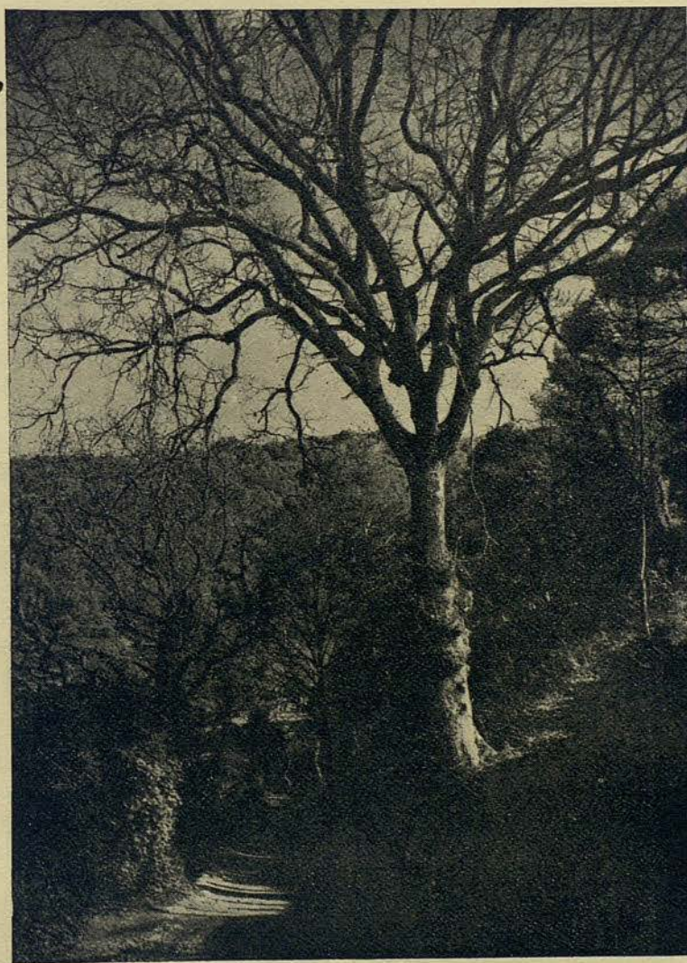
Robles y pinos forman una importante masa forestal, atravesada por senderos de singular belleza, en el Parque de Vallvidrera