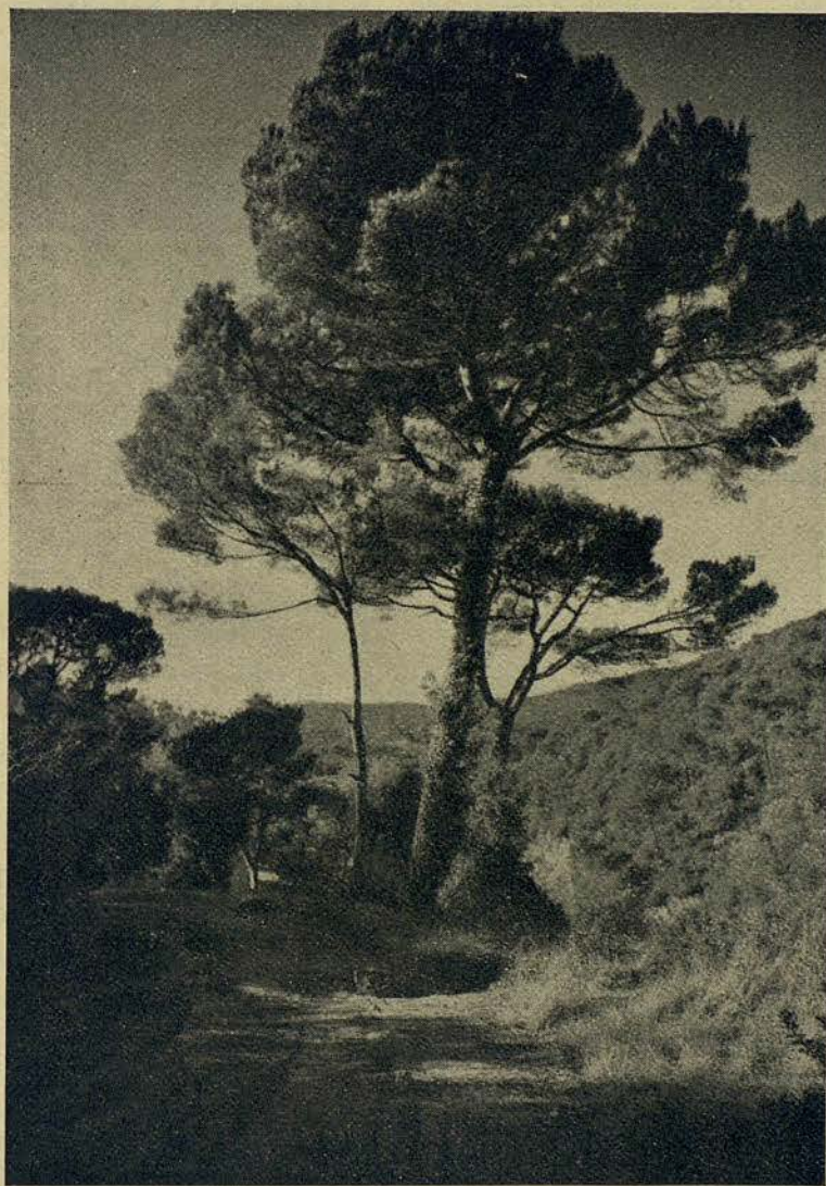
Pinus halepensis , junto a un camino del Parque del Tibidabo