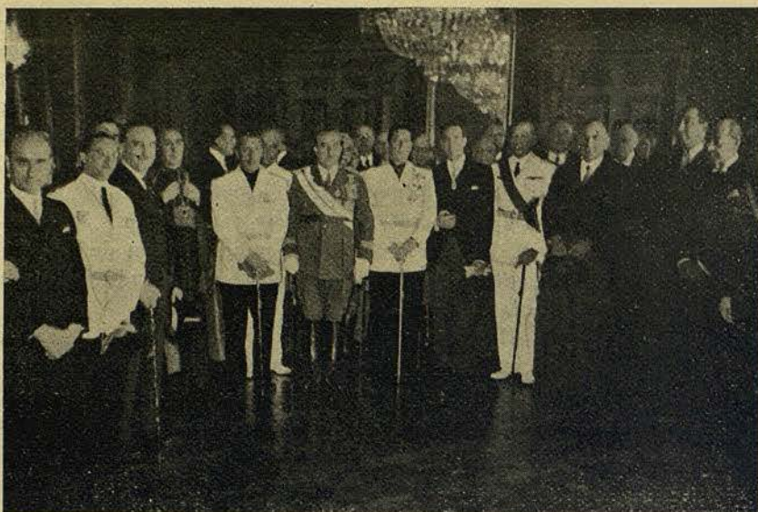
El Excelentísimo Ayuntamiento y las autoridades que concurrieron a la recepción de Capitanía