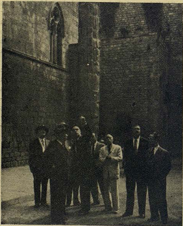
Los parlamentarios norteamericanos visitando el llamado Barrio gótico