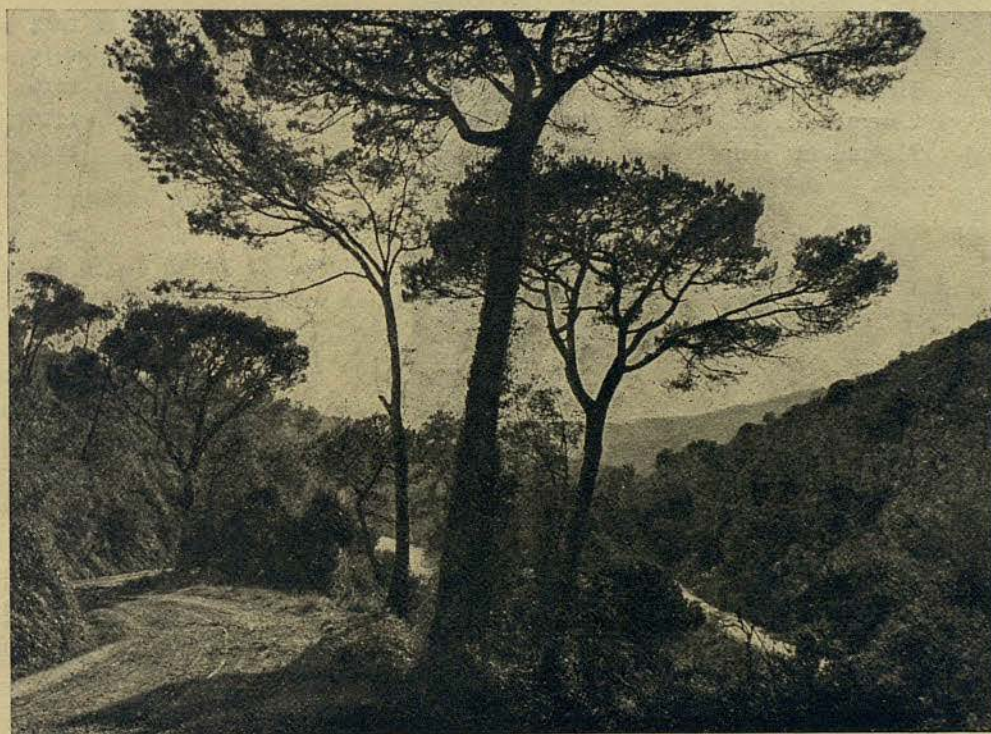
Una vista del camino de San Medín