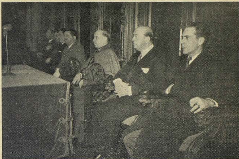
La presidencia en la sesión solemne celebrada en el Salón de Ciento con motivo del «Día del Papa»

Este, después de expresar su admiración y afecto a la región catalana, fundamental parte de nuestra querida España, se extendió en atinadas disquisiciones acerca de la comprensión de los valores espirituales de la palabra de S. S. Pío XII, cuyo estilo artístico, exposición del sentir del alma y conjunto de ideas de su doc-