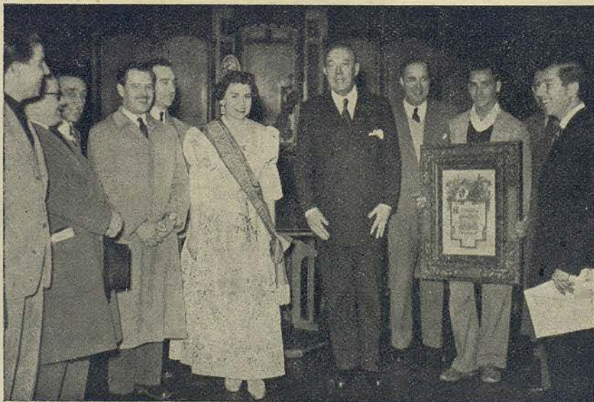
La «Embajada Fallera» haciendo entrega, al Excmo. Sr. Barón de Terrades, de un artístico pergamino, obsequio del señor Alcalde de Valencia

Durante la semana del 6 al 12 del corriente se registraron en Barcelona 339 nacimientos y 293 defunciones.