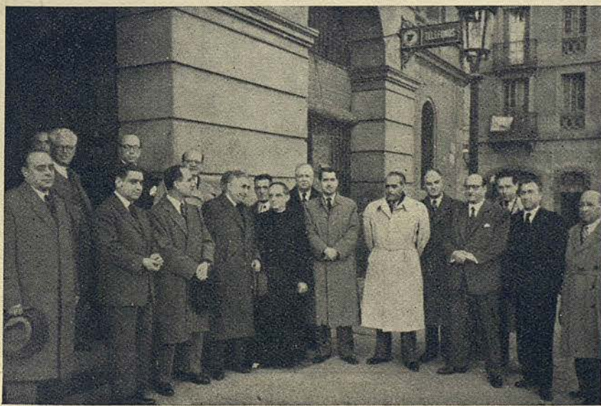
Personalidades asistentes a la inauguración del locutorio de teléfonos instalado en la Tenencia de Alcaldía del Distrito X

Fué instalado otro locutorio por la Compañía Nacional de Teléfonos de España en una de las dependencias de la Tenencia de Alcaldía del Distrito X, antigua Casa Consistorial de la ex villa de San Martín de Proven-