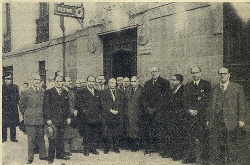
Las autoridades municipales y demás personalidades que asistieron a la inauguración del nuevo locutorio público