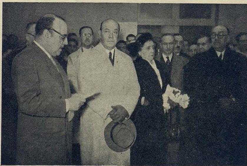
Los concurrentes al acto inaugural

A continuación las autoridades, acompañadas por los concurrentes, visitaron los quirófanos, dispensario, laboratorio y demás dependencias e instalaciones del pabellón dedicado al aspecto quirúrgico de las enfermedades infecciosas.