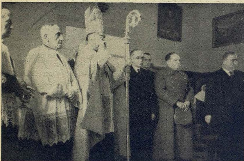
El señor Obispo de la Diócesis bendiciendo el nuevo Pabellón del Asilo de Port