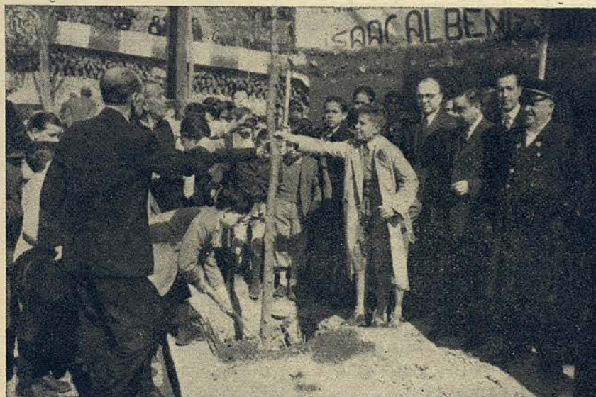
Aspecto que ofrecía el Parque Güell durante la Fiesta del Árbol celebrada en el mismo