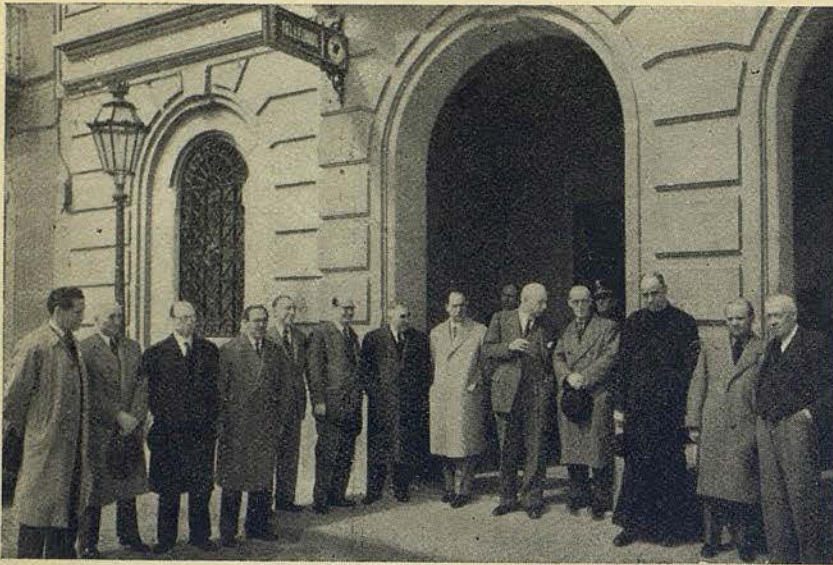
Personalidades que concurrieron al acto inaugural del nuevo locutorio telefónico de Las Corts

pronunciaron palabras expresando el deseo del Ayuntamiento y de la Compañía Telefónica, de facilitar al público los servicios de comunicaciones.