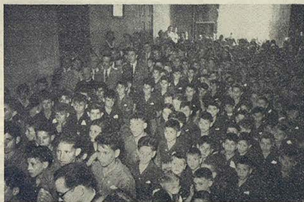
Los componentes de la «Ciudad de los Muchachos» escuchando el parlamento del señor Alcalde

Los visitantes salieron muy bien impresionados de la entrevista, es-