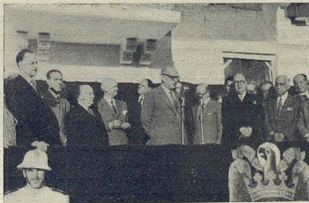
Las autoridades durante la inauguración de la línea del tren subterráneo del Clot

A continuación hubo la nota emotiva de los alumnos