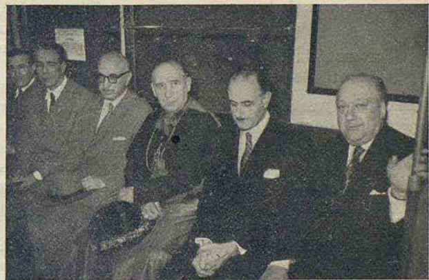
Detalle de la inauguración del Metro Transversal en su prolongación hacia la avenida de la Meridiana

Con sencillos conceptos, la distinguida pedagoga declinó todo elogio, que trasladó a la Escuela que regenta, y recordando que el 4 de febrero de 1900, el Ayuntamiento de Barcelona