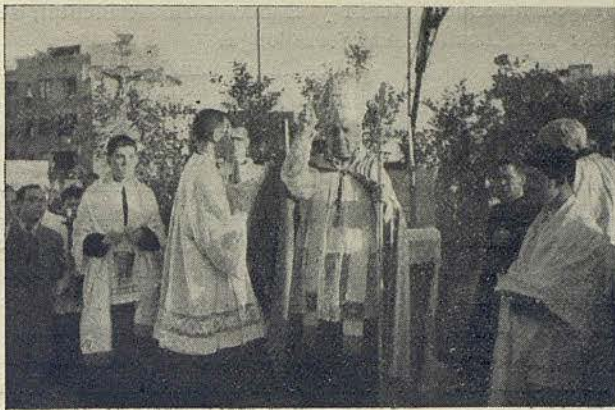
El reverendísimo e ilustrísimo señor Obispo bendice la prolongación del Metro Transversal