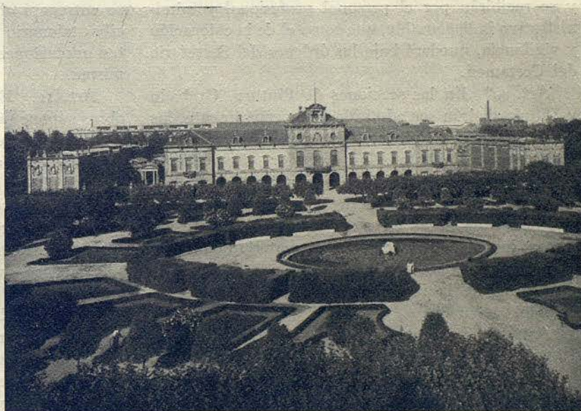
Edificio del siglo XVIII del Parque de la Ciudadela que albergará la Exposición Municipal de Arte de Otoño de 1951

El Reglamento por el cual habrá de regirse el Certamen se halla concebido en los términos que se indican en las páginas siguientes.