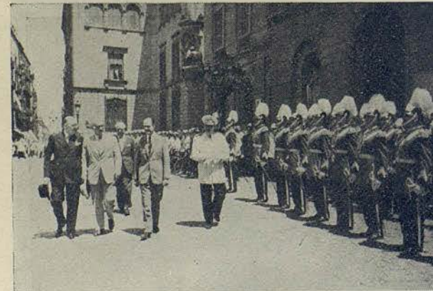
Diferentes momentos de la revista de la Guardia Urbana con los uniformes de verano, verificada, en la plaza de San Jaime, por el excelentísimo señor Alcalde

bena de San Pedro, esta Alcaldía-Presidencia, si bien no quiere coartar la diversión pública, cuando ésta discurre por cauces lícitos y admisibles, sí desea evitar que dicha ocasión sirva para que se reproduzcan accidentes o se ponga en peligro la seguridad del vecindario, y a este efecto, y usando de las facultades generales y, concretamente, de las que sobre fiestas populares le concede el art. 136 de las vigentes Ordenanzas Municipales, estima oportuno disponer lo siguiente: