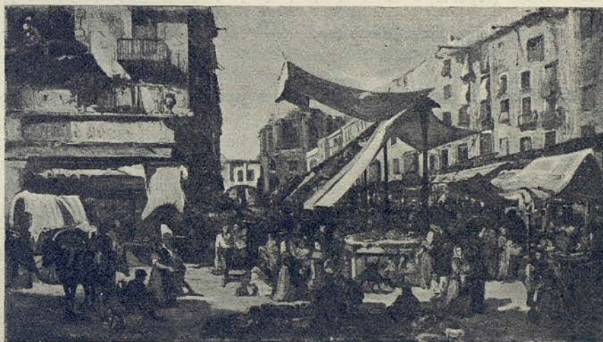
El «Borne Viejo», visto por Ramón Martí Alsina, en la tela que se admira en el Museo de Arte Moderno