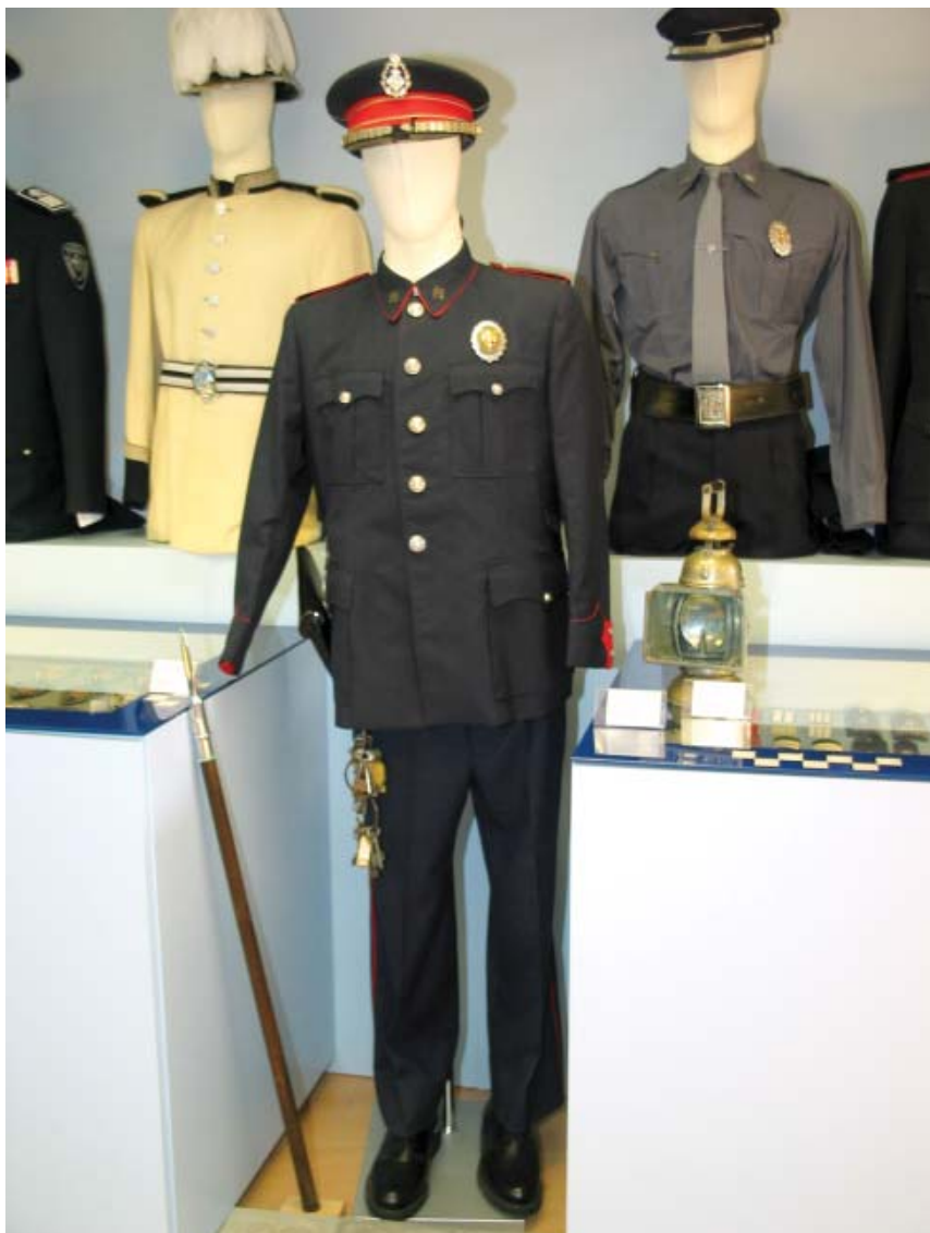
A dalt, uniforme complet de sereno de l'any 1956 que s'exposa al museu de la Guàrdia Urbana, a Prefectura