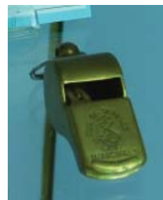
A l'esquerra, un fanal de sereno de l'any 1920. A dalt, xiulet datat del 1933. Per sota, una defensa de goma de 1931 (superior) i de fusta de 1952 (inferior)