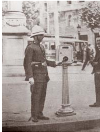
Un guàrdia municipal de l'època regulant el trànsit

"El guàrdia urbà actual desenvolupa una tasca educativa cap al ciutadà que va en cotxe o a peu"