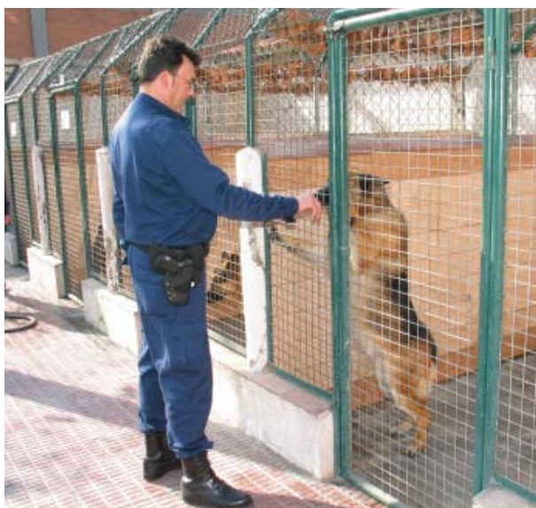
L'equip de la canina compta amb instal·lacions pròpies per tenir cura i ensinistrar els gossos policia

A més de les seves atribucions pròpies, UPAS té la "missió de donar suport als requeriments de la resta d'unitats de la Guàrdia Urbana relacionades amb aquestes funcions, d'acord amb els procediments establerts", assenyala l'intendent Vilanova. Així, les unitats de la Guàrdia Urbana poden requerir l'actuació de la UPAS en casos relatius a infraccions administratives, seguretat