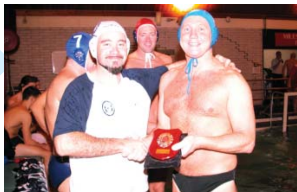
El capità va lliurar una placa commemorativa i un banderí del club als equips participants

El torneig enfrontava els equips en un "tots contra tots" per punts. L'equip de Barcelona va obrir la competició amb el partit contra els Nomads, que va finalitzar amb un balanç gens positiu per als del CEGUB (11-4). Al següent compromís, davant els bombers de Dublin, els barcelonins van materialitzar la seva superioritat amb un 10-8 final. El primer lloc però, es va decantar finalment per al conjunt de la British Police en un emocionant matx l'últim dia de torneig. Un disputat resultat de 10-6 va donar els britànics com a guanyadors del PSUK WT 2003. 🇬🇧