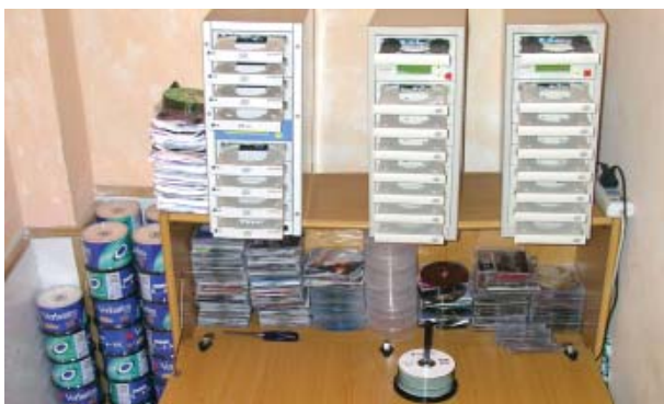
Les torres de gravació o "torradores" es fan servir per copiar CDs de forma intensiva en espais reduïts

Un dels cops de més transcendència realitzats per la Guàrdia Urbana en l'àmbit de la pirateria musical va ser la detenció de dues persones i la intervenció de 15.700 CDs i dues torres de gravació, en un operació encapçalada per la Unitat de Policia Administrativa i Seguretat (UPAS) el passat 23 d'octubre a un pis del carrer Cendra de Ciutat Vella. Especialment colpidor va ser el cas de la detenció de dos menors de 10 i 13 anys dedicats a la còpia intensiva i proveïment de CDs a dos pisos situats a la Rambla del Carmel i el carrer de Vallldonzella. En aquesta operació es van decomissar 13.500 CDs i es van intervenir tres torres de gravació.