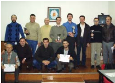
Foto de família dels guàrdies premiats en l'OEM Lluís Boix