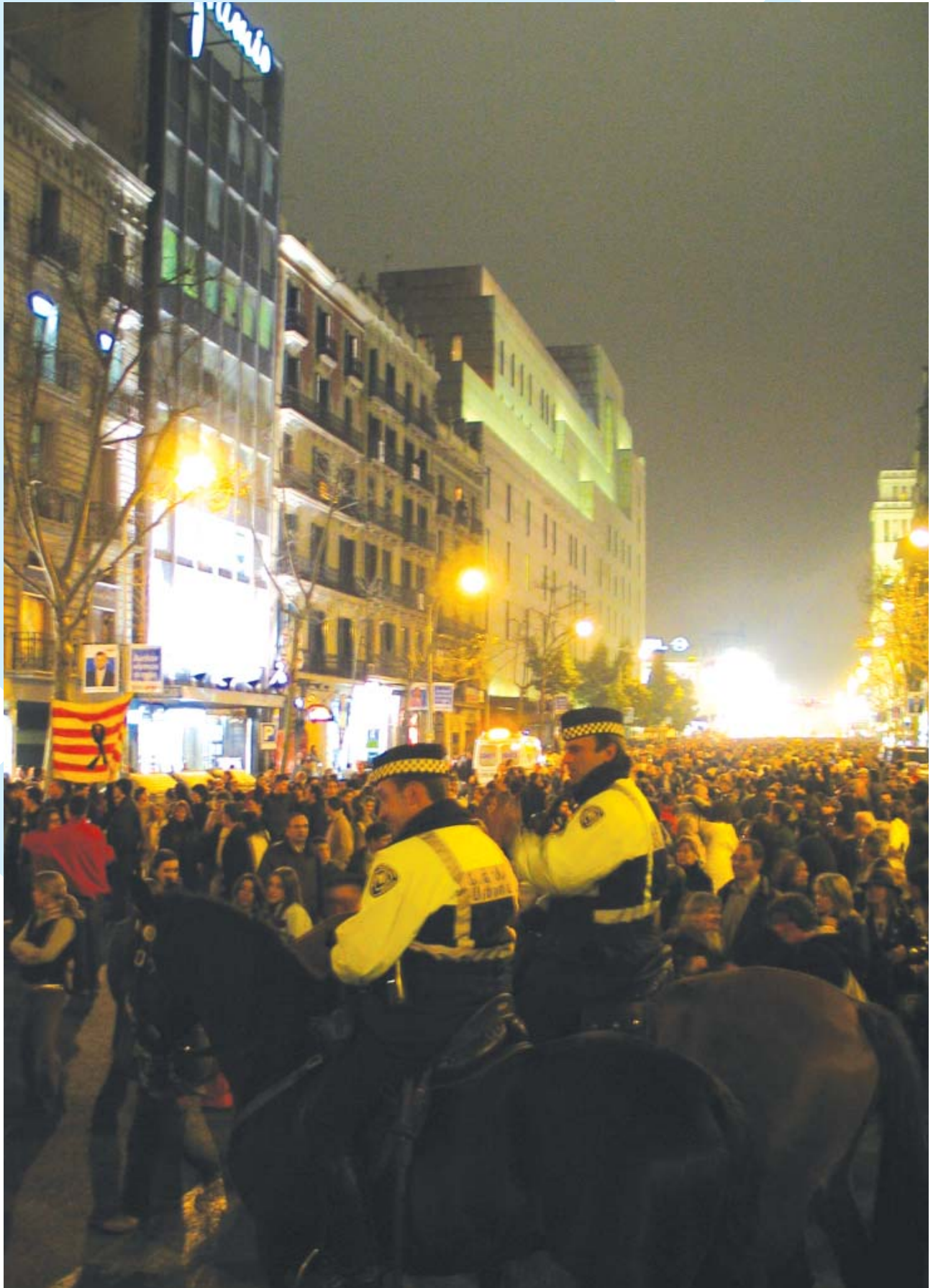
La Guàrdia Urbana va realitzar un desplegament especial amb motiu de la manifestació solidària contra el terrorisme el 12 de març