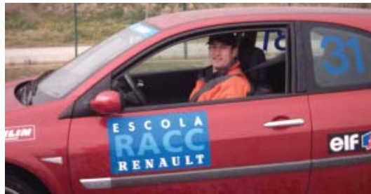
El curs de conducció es va realitzar a l'Escola RACC

A l mes de febrer es va realitzar una nova edició del curs de conducció bàsica policíaca per a agents de la Guàrdia Urbana a l'Escola RACC Renault de Turismes, situada al circuit de Catalunya.