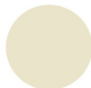
RAL 1013 // 234-230-202

Seran de color cru: RAL-1013. Per a altres colors caldrà aportar un estudi de conjunt de l'àmbit de la Distribució Prèvia, que haurà de ser aprovat per la Comissió Tècnica de Terrasses.