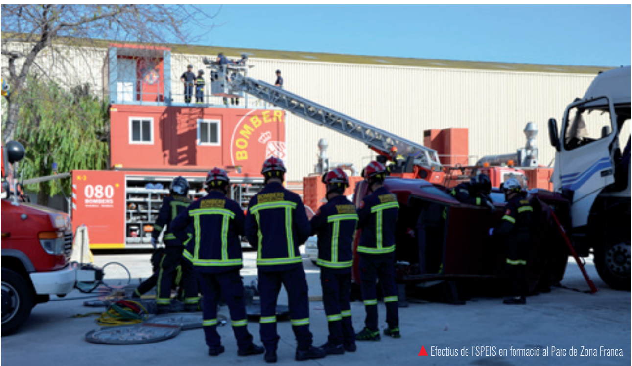
▲ Efectius de l'SPEIS en formació al Parc de Zona Franca

de Bombers. Així, es va poder elaborar un primer esbós dels documents que després han estat valorats i comentats per tots els professionals del Cos. Amb la incorporació de les esmenes provinents de diferents nivells jeràrquics de l'SPEIS, des dels comandaments fins als bombers, s'han aprovat finalment els documents. 🚒