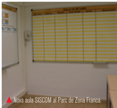
▲ Nova aula SISCOM al Parc de Zona Franca.

Dintre de la programació formativa de comandaments d'aquest any, per primera vegada formadors de l'ENSOSP s'han desplaçat a Barcelona per formar en gestió d'emergències a comandaments de l'SPEIS. A més, un altre grup de comandaments de Bombers s'ha desplaçat a Aix-en-Provence per fer una segona edició del curs d'assessor químic.