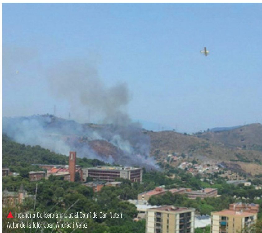
▲ Incendi a Collserola iniciat al Camí de Can Notari.

Els resultats de la campanya d'estiu de 2015 de l'SPEIS van ser pitjors que els dels darrers anys tot i reduir-se el nombre d'incendis i mantenir-se el nombre de guardes preventives. Les condicions climatològiques estan al darrere d'aquests resultats: la falta de pluges a la primavera, acompanyada d'un inici d'estiu molt sec i calorós, van propiciar que la vegetació es trobés en una situació de sequera extrema en la qual el foc va tenir condicions molt favorables per desenvolupar-se. En total, durant la campanya d'estiu l'SPEIS va estar en situació de pre-alerta durant 46 dies dels quals 37 en pre-alerta meteorològica i 9 en pre-alerta crítica.