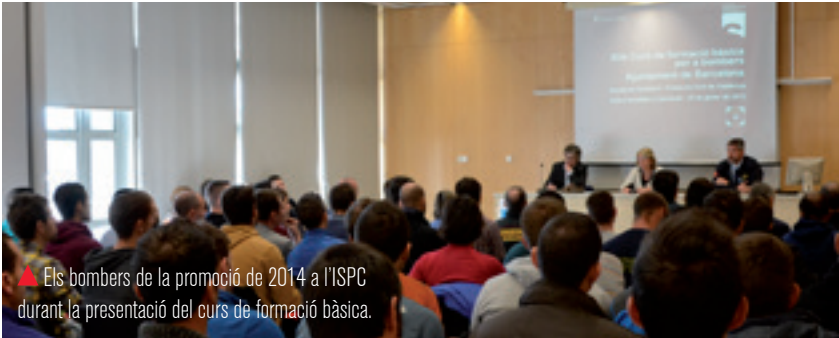
▲ Els bombers de la promoció de 2014 a l'ISPC durant la presentació del curs de formació bàsica.

Els 60 aspirants de la convocatòria de 2014 ja es formen als Parcs, i de la selecció de 2015 ja s'han realitzat tres proves