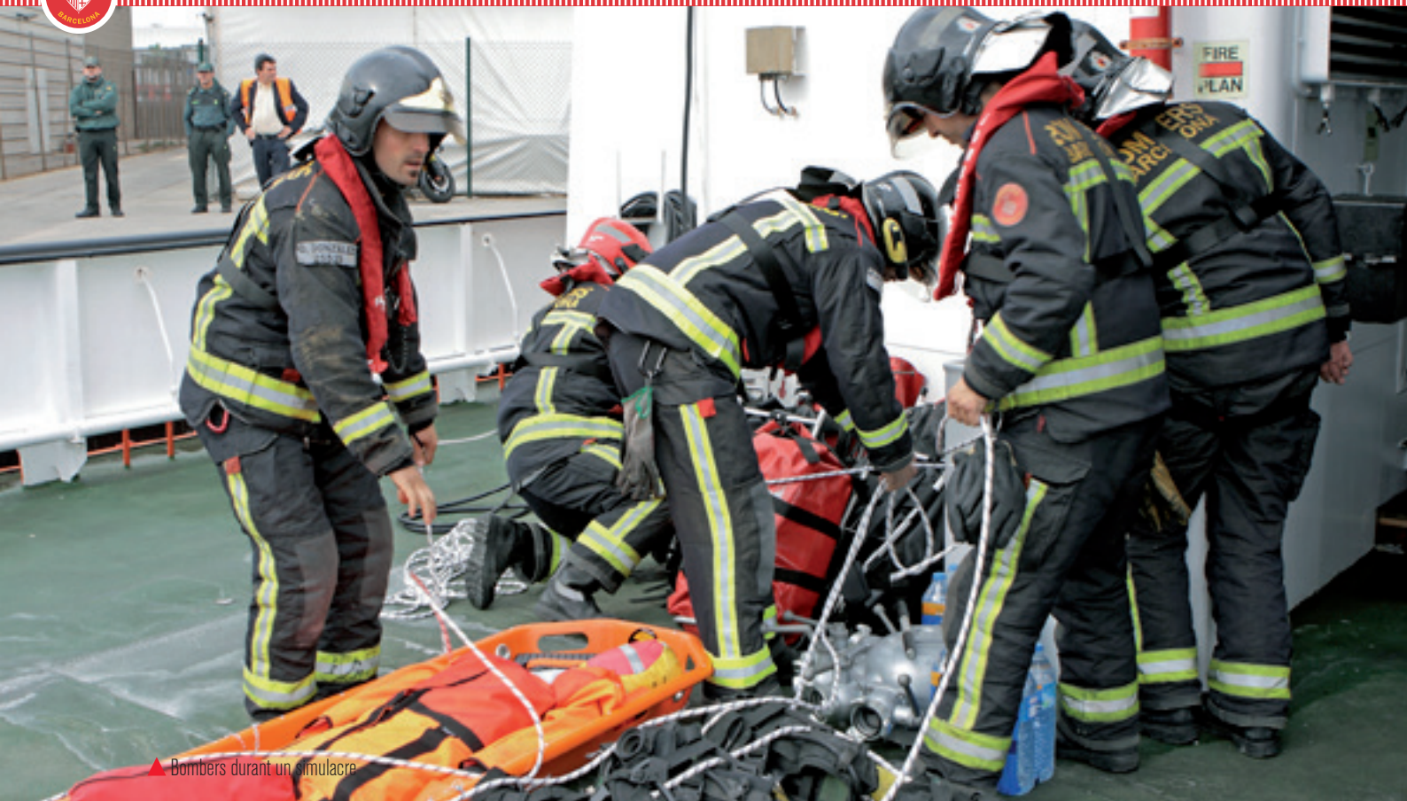
▲ Bombers durant un simulacre