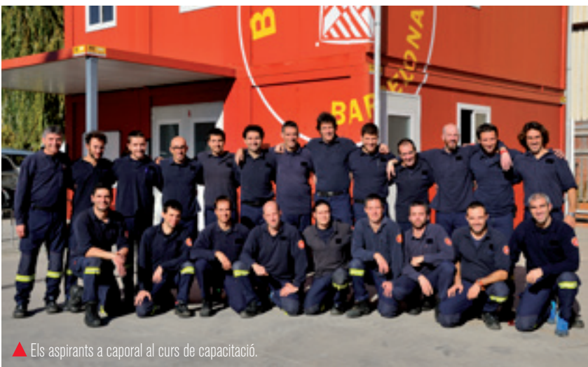
▲ Els aspirants a caporal al curs de capacitatció.

La darrera convocatòria de promoció interna va seleccionar 21 aspirants a caporal que durant octubre i novembre es van formar per al nou càrrec. El curs de Capacitatció de Caporals de l'Institut de Seguretat Pública de Catalunya que van seguir té una durada de 245 hores i, per primera vegada, correspon a estudis oficials del cicle de grau superior: Tècnic superior en coordinació en emergències i protecció civil. La temàtica del curs es divideix en diversos mòduls entre els quals hi ha Capacitats i habilitats del comandament, Incendis urbans, forestals i industrials, Rescat, Prevenció i protecció civil, Cohesió d'equips o Gestió de recursos. 🚒