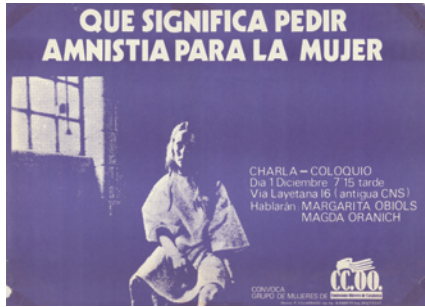
Cartell del Grup de Dones de CCOO, 1977. CLD