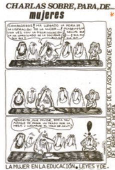
Cartell de la Vocalia de Dones de l'Associació de Veïns del Barri d'Horta, 1976. CLD

en valors i jerarquies androcèntriques. Però si observem amb atenció i sense prejudicis les seves mobilitzacions, podrem comprendre millor que la seva contribució al sistema democràtic en el qual vivim, al benestar i la sostenibilitat humana i a unes relacions més justes, equitatives i lliures és un patrimoni comú.