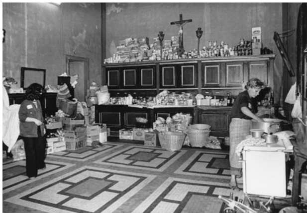
Tancament de les dones dels treballadors de Motor Ibérica a l'església de Sant Andreu de Palomar. L'acció va durar 28 dies, fins que van ser desallotjades per la policia, 1976.