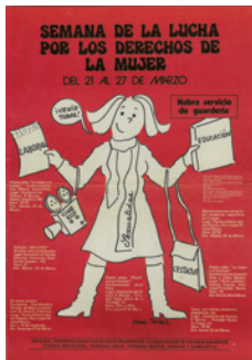
Cartell de la Coordinadora de Vocalies de Dones de les Associacions de Veïns de Nou Barris, (sense data). Il·lustració de Núria Pompeia. CLD