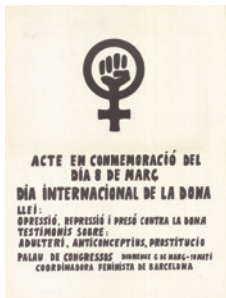
Cartell d'un acte del 8 de març (sense data). CLD