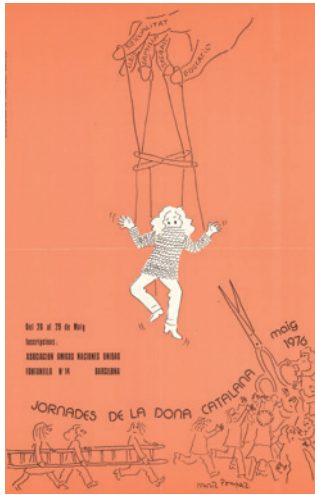
Jornades Catalanes de la Dona, 1976. Il·lustració de Núria Pompeia. CLD