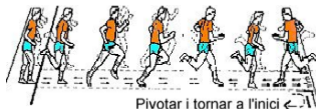
Pivotar i tornar a l'inici ←

Es farà un sol intent, i es registrarà el número del darrer palier anunciat.